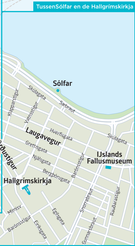
Tussen Sólfar en de Hallgrímskirkja