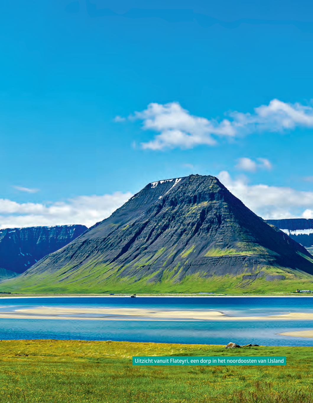
Uitzicht vanuit Flateyri, een dorp in het noordoosten van IJsland