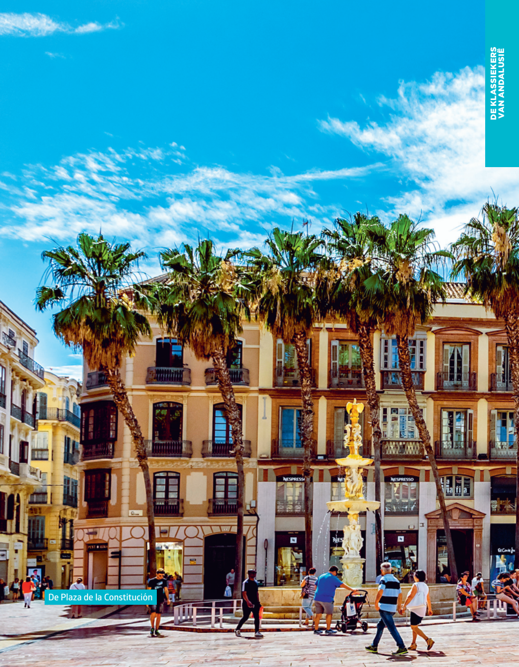
De Plaza de la Constitución