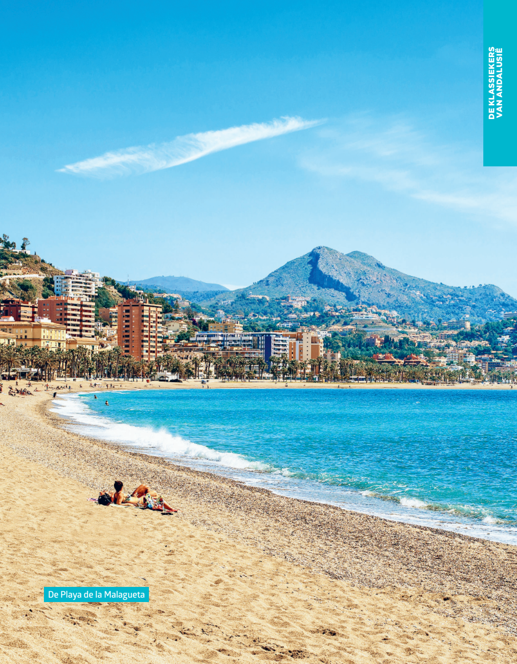
De Playa de la Malagueta