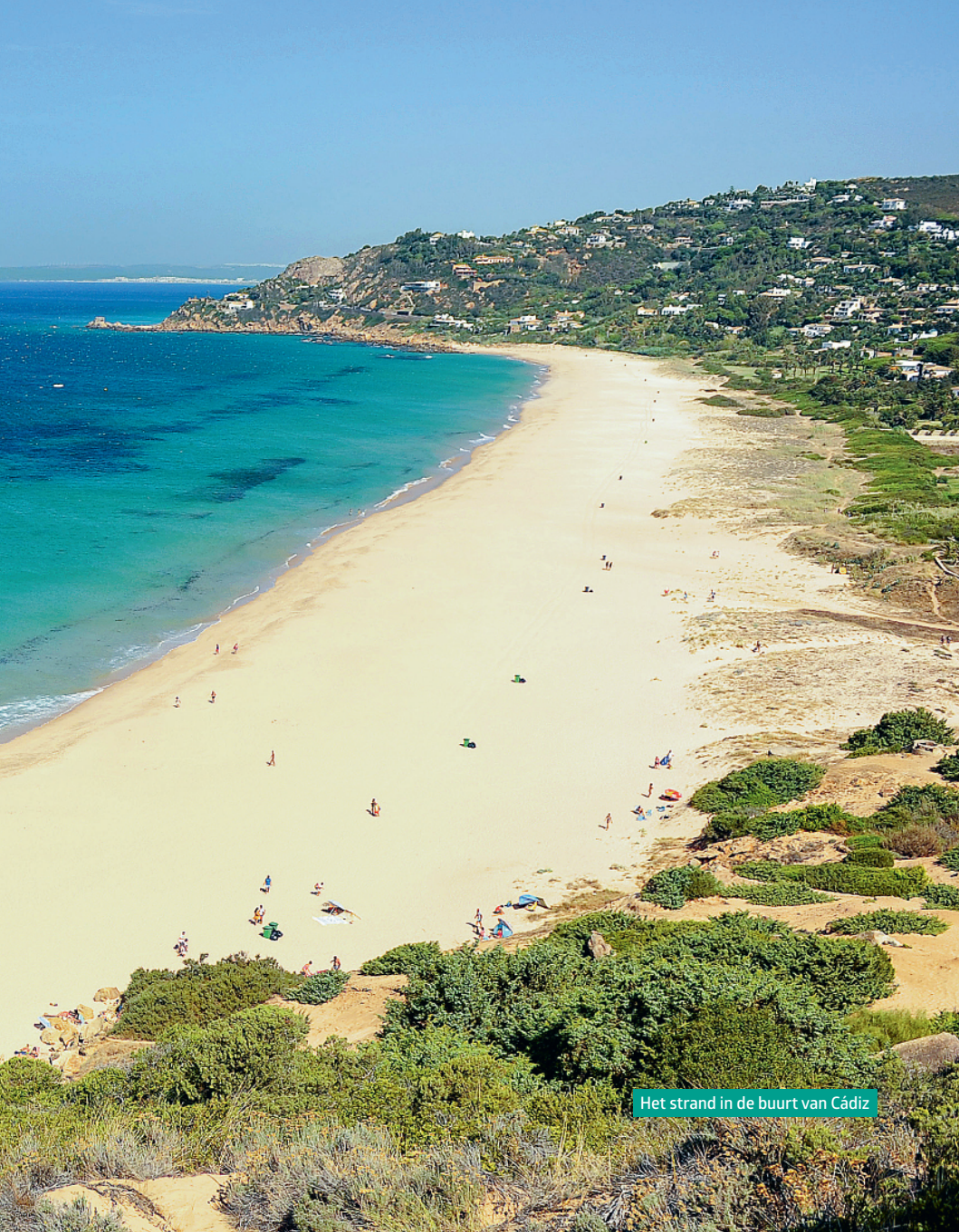
Het strand in de buurt van Cádiz