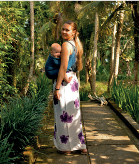
Kinderen zijn koning in Indonesië.