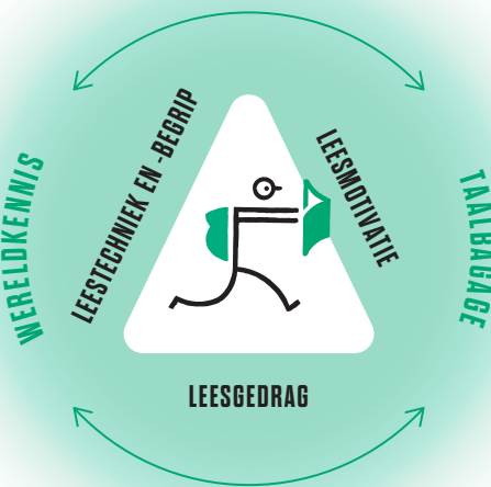
Figuur 1 Leesdriehoek

Maar wat maakt lezen nu zo uitdagend? In onderstaande ‘leesdriehoek’ staat de wisselwerking tussen leesvaardigheid (leestechniek, leesbegrip), leesmotivatie en leesgedrag centraal. 5 Leesvaardigheid is een combinatie van technisch lezen en begrijpend lezen. Die leesvaardigheid van kinderen en jongeren beïnvloedt hun leesmotivatie en leesgedrag. Met andere woorden: leerlingen die beter lezen, lezen vaker liever en vice versa. Het is immers motiverender om iets te doen als je er goed in bent. 6 Kinderen en jongeren die een sterke basis hebben in leesvaardigheid en gemotiveerd zijn tot lezen, lezen bovendien frequenter en worden daardoor steeds sterker in lezen. Er is dan sprake van een positieve leesspiraal . 7 Lezen is een complex proces dat daarnaast ook beïnvloed wordt door de wereldkennis en de taalbagage van een lezer.