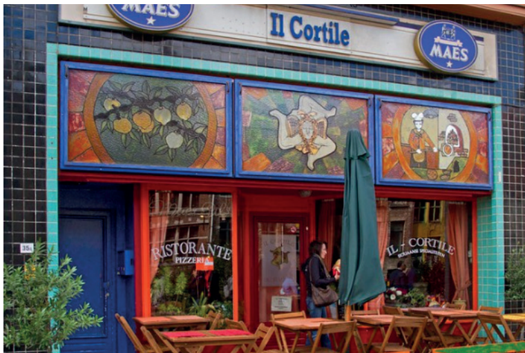
Il Cortile, een echte trattoria in Gent