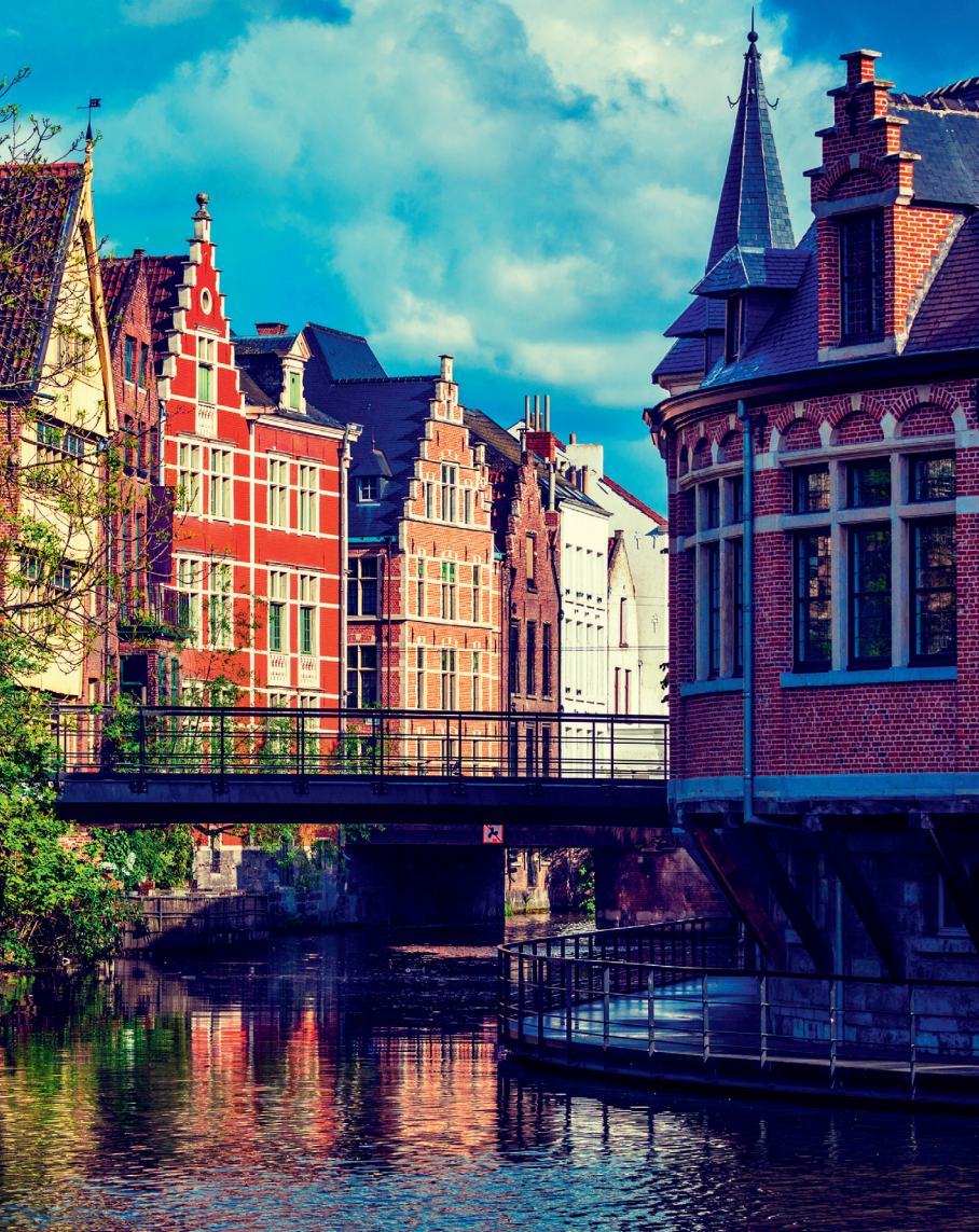
De Lieve stroomt in Gent langs het Gravensteen, de Lievekaai, het Prinsenhof en het Rabot.