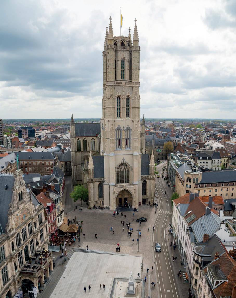
Het Sint-Baafsplein en de Sint-Baafskathedraal met zijn 89 m hoge toren, gefotografeerd vanaf de Belfortoren