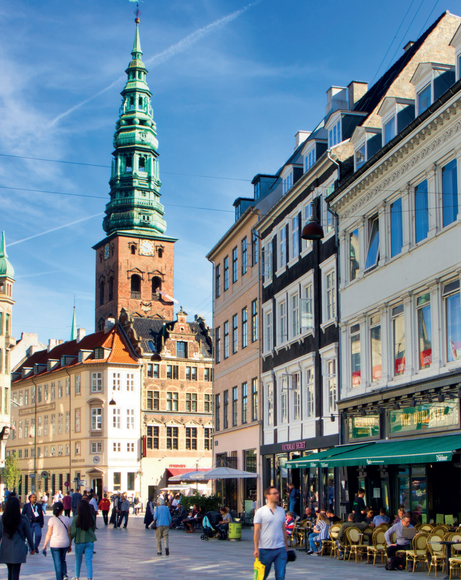
Het Amagertorv is een van de pleinen die de Strøget omvat.