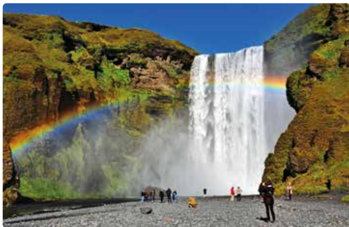
◀ De Skógafoss, de 'boswaterval', aan de voet van de vulkaan Eyjafjallajökull

hebt u zin om ook een kijkje te nemen bij enkele plaatsen uit de 'Njáls saga', anders rijdt u verder. Voor u liggen de gletsjers Eyjafjallajökull en Mýrdalsjökull, vanaf de weg hebt u er een goed uitzicht op. Wanneer u bij de 254 komt, neemt u die en die brengt u na 17 kilometer bij de kleine haven Landeyjahöfn, een haven die speciaal is aangelegd voor de 'Herjolfur', de veerboot naar Heimaey .