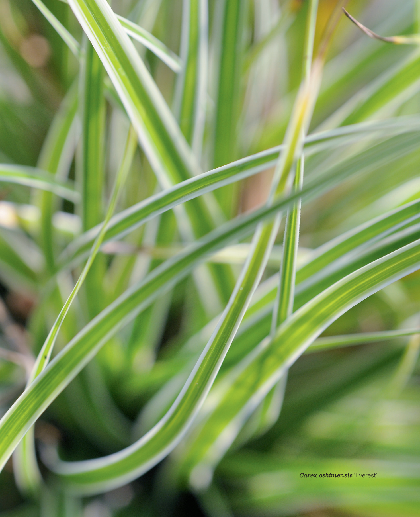
Carex oshimensis 'Everest'