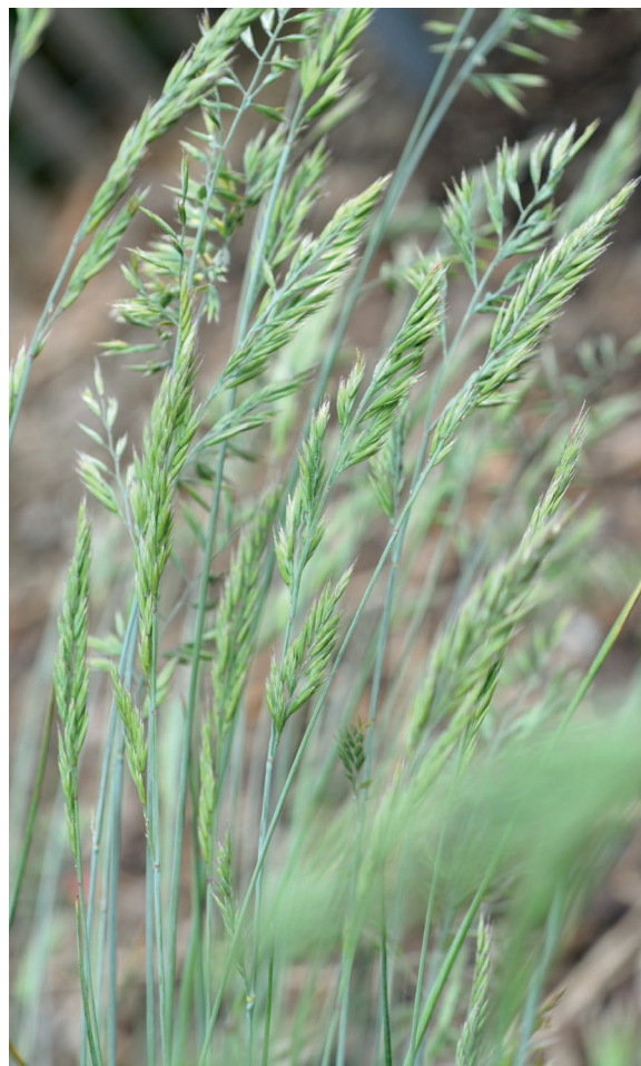
Molinia caerulea 'Strahlenquelle'