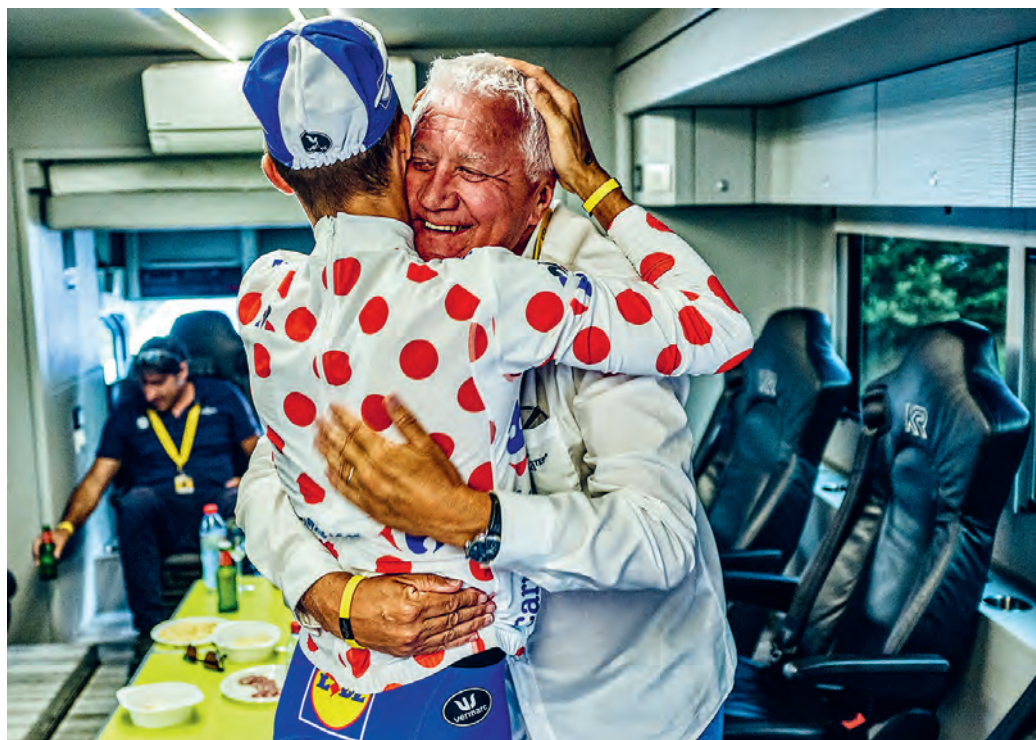
Patrick Lefevere en Julian Alaphilippe

“Dat komt volgens mij omdat ze hier nog die arbeidsvreugde vinden en ervaren, ondanks het feit dat het allemaal heel professioneel is. De maatschappij is hard, maar ik mag stellen dat we toch menselijk zijn. Een renner