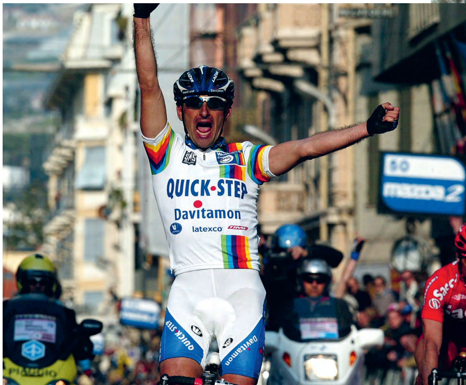
Paolo Bettini, Patrick Lefevere • Milaan-Sanremo 2003