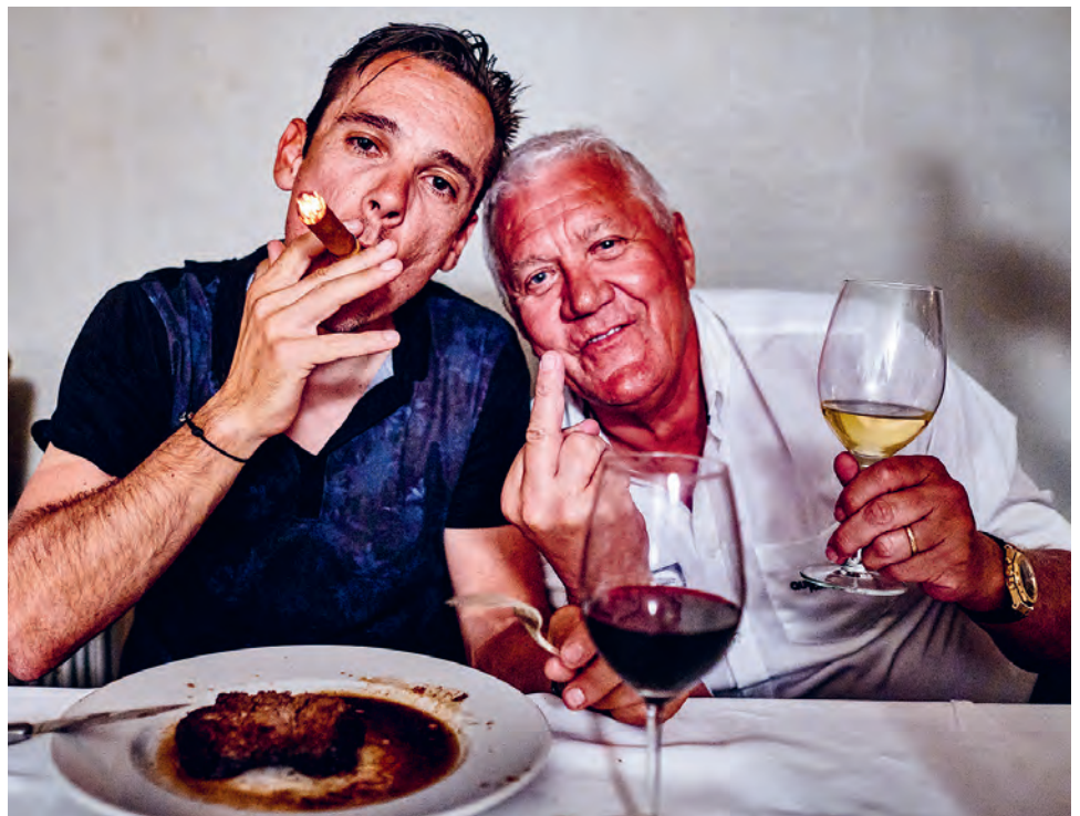
Philippe Gilbert, Patrick Lefevere