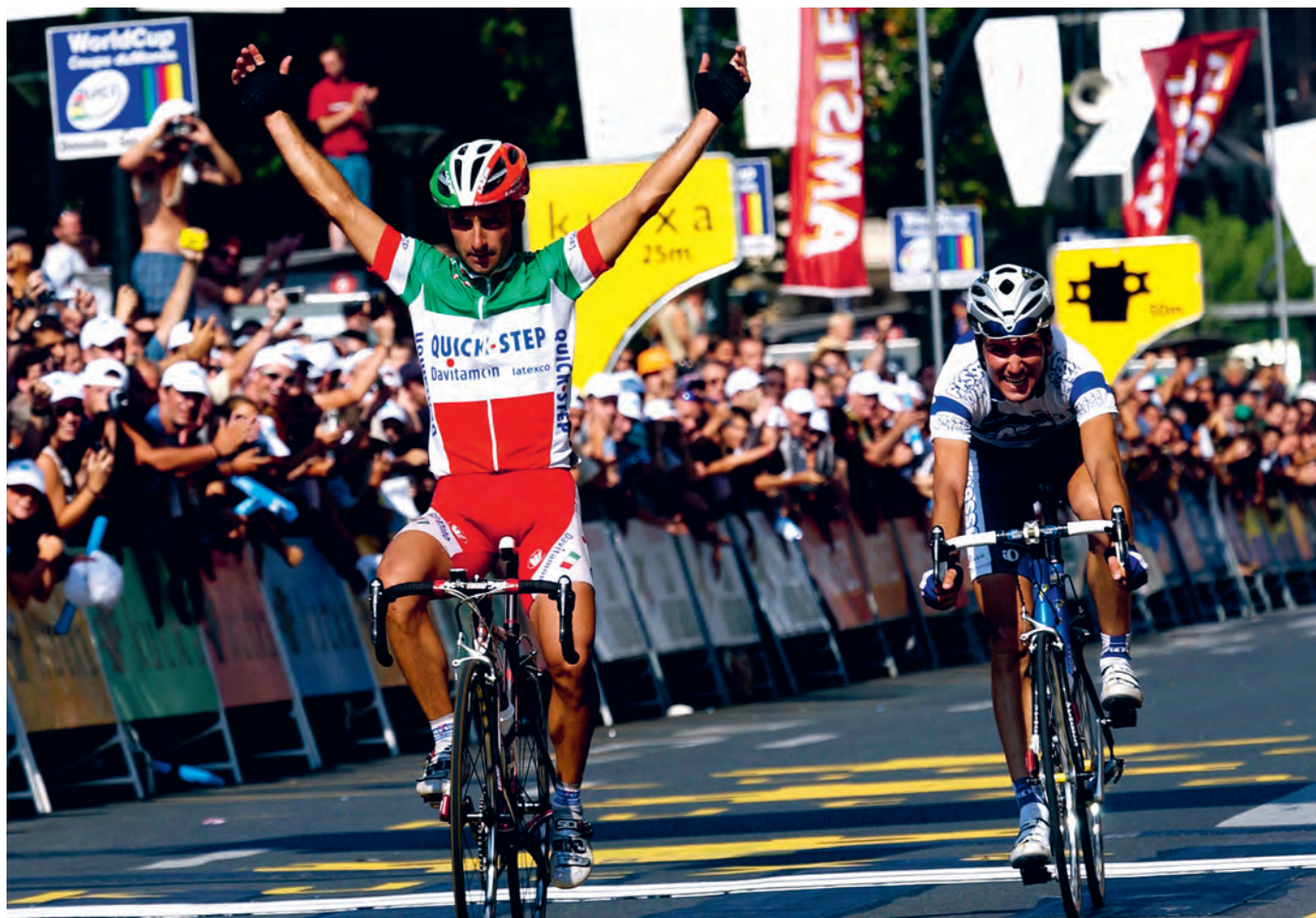
Paolo Bettini • Clásica San Sebastian 2003

“Hoe wil je dat ik win? Solo of in de spurt?” Over zelfvertrouwen gesproken. Het zat er zowat tussenin. Eén lang lint was het. Basso in het wiel, Di Luca op 2 seconden en de rest volgde druppelsgewijs. Het werd voor de Krekel een van de mooiste seizoenen en een voorbode voor wat nog komen zou.