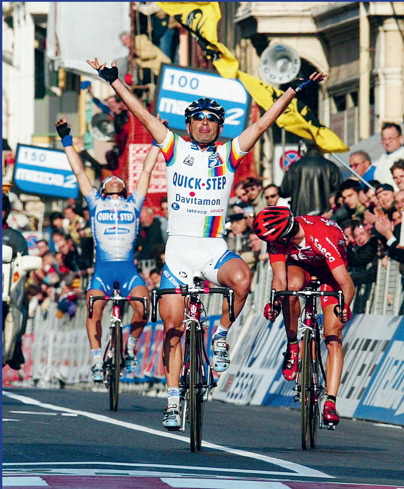
Luca Paolini, Paolo Bettini, Mirko Celestino • Milaan-Sanremo 2003.