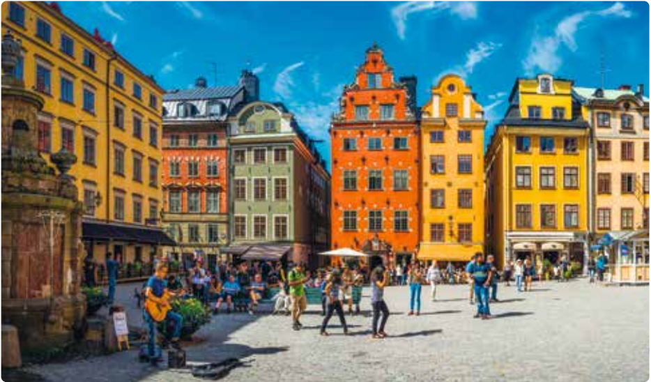
▲ Bontgekleurde gevels sieren de Gamla Stan.

door haar strategische ligging raakte de stad steeds weer in oorlogen verwickeld. Als dank omdat Stockholm bij de opstand tegen de Deense koning de zijde van de rebellen had gekozen, werd de stad in 1436 aangeduid als hoofdstad van Zweden.