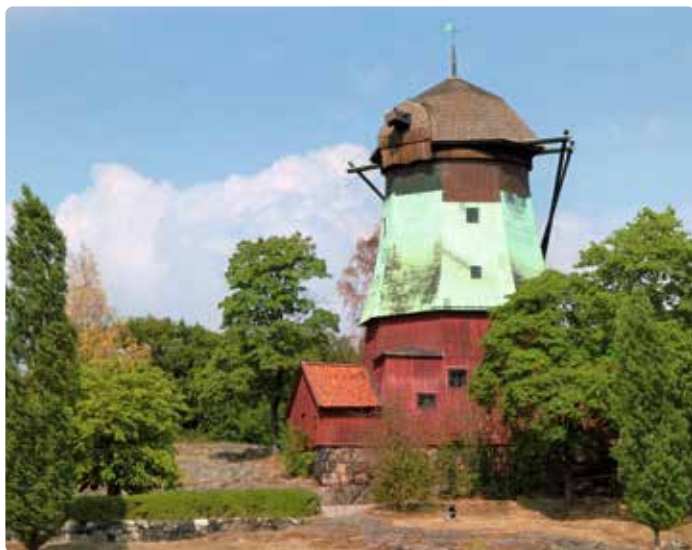
◀ Authentieke Scandinavische houtarchitectuur: molen in het openluchtmuseum Skansen

Op het eiland Djurgården kun je luiere en plezier maken, maar ook genieten van cultuur en uitstekende musea bezoeken. Djurgården ligt slechts een paar minuten van Gamla Stan, het is de groene long van de stad en tegelijk het grootste recreatiegebied van Stockholm. Het is nauwelijks bebouwd en er rijden bijna geen auto's. Ooit was dit een koninklijk jachtdomein en later trok het rijke Zweden aan. De prachtige, oude houten huizen van die laatste verlenen het eiland zijn kenmerkende uitstraling.