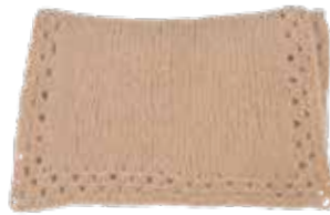
Toffee p. 100