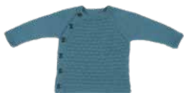
Hugo p. 34