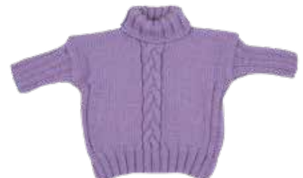
Gabrielle p. 116