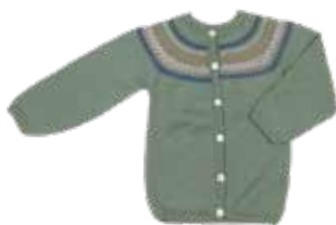
Fidel p. 42