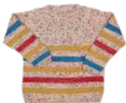
Bas p. 78