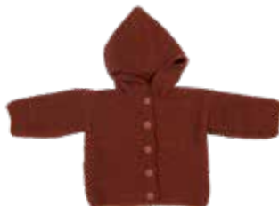
Wallie p. 18