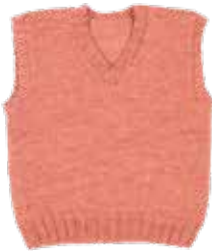
Vince (V-hals) p. 76