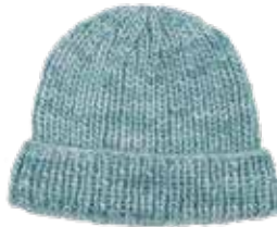
Anna #3 p. 65