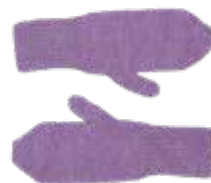
Selma p. 72