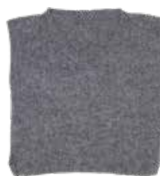
Lea p. 102