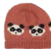
Panda p. 126