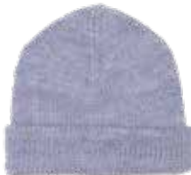
Selma #3 p. 70