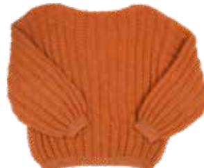
Pola p. 80