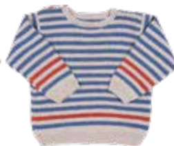
Olaf p. 88