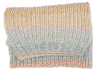
Rainbow p. 108