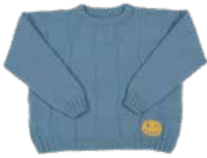
Jara p. 48