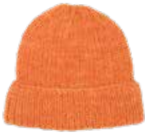
Selma #1 p. 66