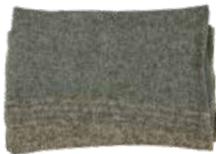
Mateo p. 99