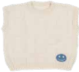
Jutta p. 50