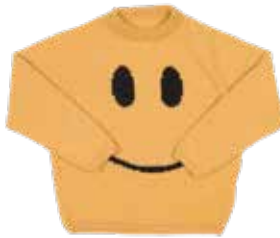
Tess p. 54