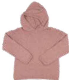
Aurore p. 92