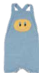
Nova p. 52