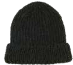
Matthis p. 97