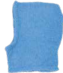
Llama p. 104