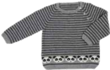
Mia p. 91