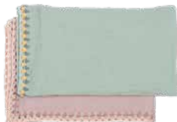
Lara p. 26