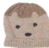
Coco p. 22