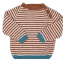
Leon #2 p. 124