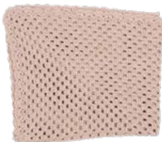
Bas p. 24