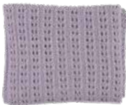
Lavender p. 110