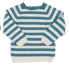
Leon #1 p. 122