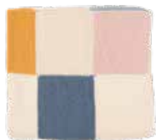
Juliette p. 16