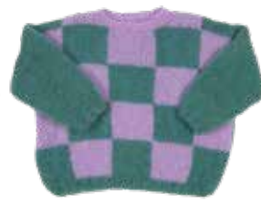
Noah p. 112