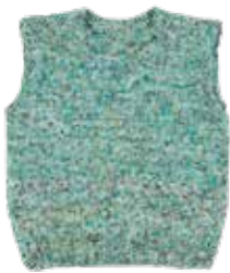
Vince (ronde hals) p. 76