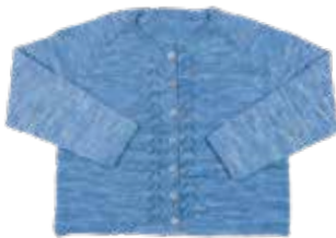
Merel p. 58