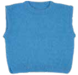
Lore p. 106