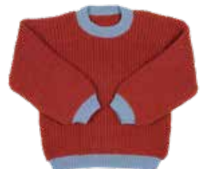
Free p. 84