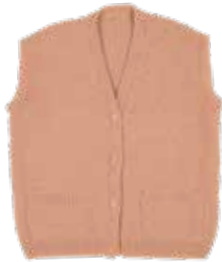
Lucas p. 86