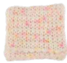
Bo p. 120