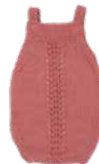
Cil p. 40