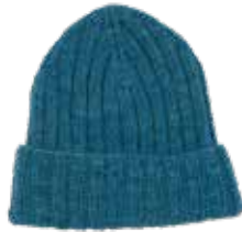
Selma #2 p. 68