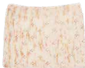
Eleonore p. 28