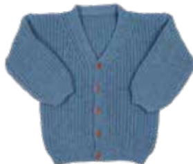
Ward p. 82