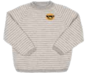
Gus p. 56