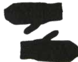
Korneel p. 98