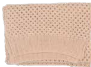
Powder p. 118