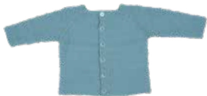
Boris p. 36