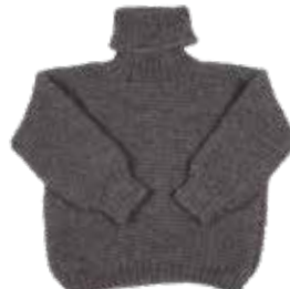
Hygge p. 114