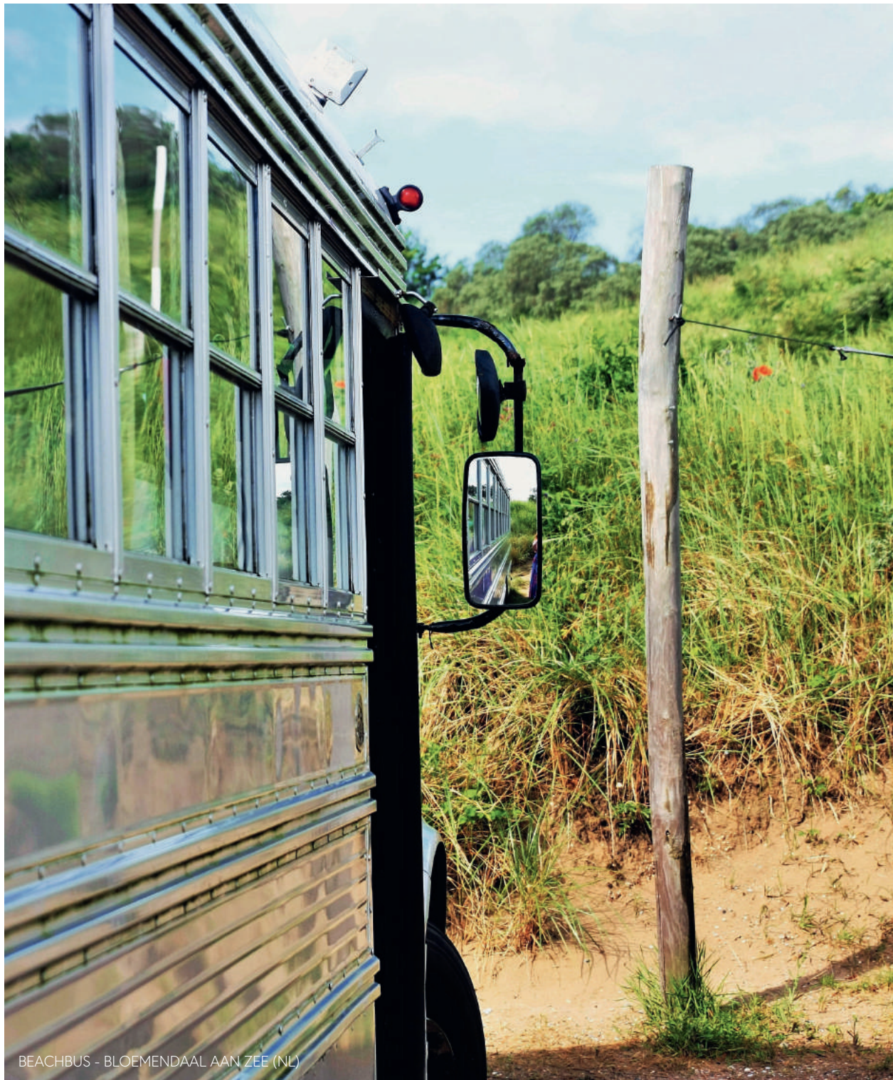
BEACHBUS - BLOEMENDAAL AAN ZEE (NL)