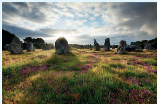
2 Carnac Deze populaire badplaats was al in de oertijd geliefd. Getuigen daarvan zijn drieduizend menhirs (daterend van 4000-2000 v. Chr.) en andere stenen reuzen.