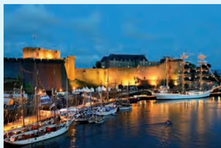
3 Brest De grootste oorlogshaven van Frankrijk werd tijdens WO II bijna volledig verwoest. Nu is Brest een van de modernste steden van het land.