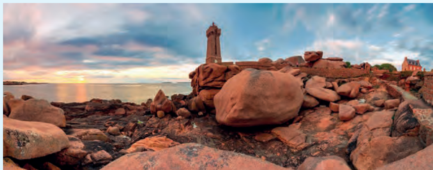
1 Côte de Granit Rose Pittoreske rozerode rotsen bepalen het uiterlijk van het noordelijkste punt van Bretagne. De wind en de golven hebben vele ervan glanzend geslepen.

tiedorpjes. Uit de duizenden jaren oude geschiedenis zijn zo veel relikten achtergebleven, dat de streek net een openluchtmuseum is. Kastelen en herenhuizen, abdijen, kathedralen en historische steden met vakwerkhuisen en stenen gebouwen getuigen van de oude macht en welvaart. Aan de donkere oorlogstijden herinneren de massieve burchten en wachttorens. In Normandië zwaaiden tot in de 5de eeuw de Kelten, Romeinen en Germanen de scepter. Toen kwamen de Vikingen en de Noormannen. Eeuwenlang leverden Engeland en Frankrijk strijd, daarna verwoestten de hugenoten het land. Dat alles was peanuts in vergelijking tot de Duitse bezetting in 1940. Vier jaar later werd Normandië herschapen in een slagveld, toen de geallieerden op 6 juni 1944 – op D-Day – landden op de stranden van Calvados en de Cotentin. Toen de inwoners van Normandië in september 1944 definitief werden bevrijd, lagen tal van steden in puin en as. Nu beleeft Normandië een van de vreedzaamste periodes in zijn geschiedenis. In de bijna 30 000 km 2 grote regio is vooral de landbouw van belang. Door