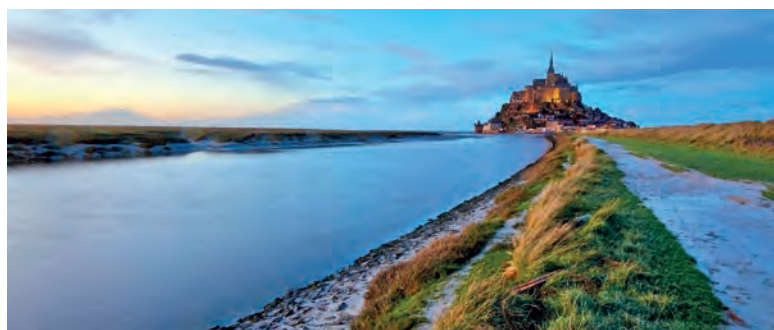
De Mont Saint-Michel behoort tot de belangrijkste bezienswaardigheden van Bretagne.

plaats, na de Côte d'Azur. De wind en de stenen, het groen van de weiden en het schuim van de Atlantische Oceaan maakten Bretagne beroemd. Zijn internationale bekendheid dankt de streek echter vooral aan Asterix en Obelix. Na koning Arthur zijn zij de bekendste Bretonnen. Het enige minpuntje is dat het dorp van beide helden nergens in Bretagne te vinden is.