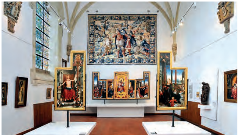
De polyptiek van Anchin, een van de topstukken van het Musée de la Chartreuse

Boven links: op het halfuur en het volle uur weerklinkt het klokkenspel van het belfort van Douai, de grootste beiaard van Europa. Kleine foto's links: niet alleen in de zomer loont een bezoek aan het Parc naturel régional de L'Avesnois de moeite.