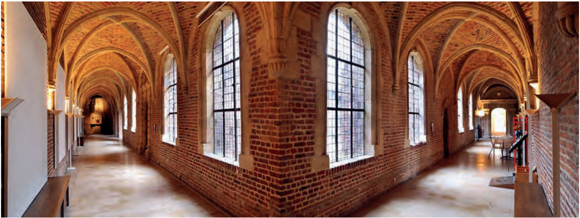
Douai: werk van Franse en Nederlandse kunstenaars is te bewonderen in het Musée de la Chartreuse.

universiteit en autofabrieken. Een wandelingje over de Place d'Armes brengt de oude glans en glorie van Valenciennes in herinnering. Werp een blik op het stadhuis met zijn prachtige barokgevel die gespaard bleef van de grote brand in 1940, en de middeleeuwse kerk St-Géry. Natuurlijkhebbers komen aan hun trekken in de tuin van La Rondelle en aan de nabije vijver Étang du Vignoble.