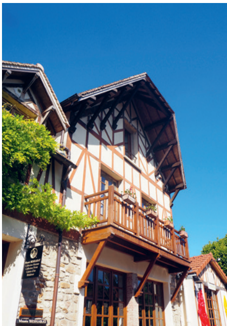
Barbizon

dat 20.000 ha beslaat. Van de middeleeuwse vesting blijft alleen een grote ronde toren over. Het kasteel werd in de renaissance grondig verbouwd en in de 19de eeuw nog een keer. Het is een belangrijke historische plek, zo stierf hier Frans I en Karel X deed er troonsafstand. Daarnaast vonden er heel wat diplomatieke gesprekken en jachten plaats, want Rambouillet was een presidentiële woonplaats. Het park is vooral bekend om zijn twee opmerkelijke gebouwen: de Chaumière aux Coquillages, met haar onwaarschijnlijke schelpenversieringen, en de Laiterie de la Reine, die naar het schijnt werd gebouwd om Marie-Antoinette bezig te houden, die zich steendoed verveelde in Rambouillet. Bezoek, voor je de stad verlaat, ook nog even de Bergerie nationale, die door Lodewijk XVI werd opgericht om merinoschapen te fokken, die nog altijd rondlopen op deze historische boerderij, naast andere dieren.