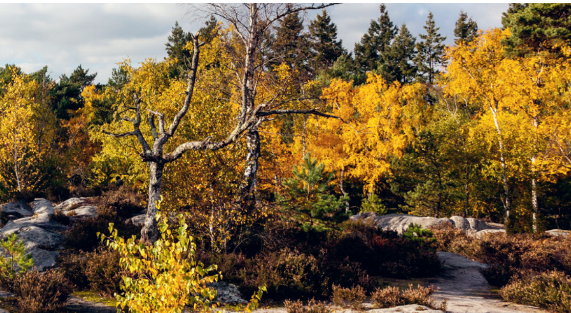
Het woud van Fontainebleau