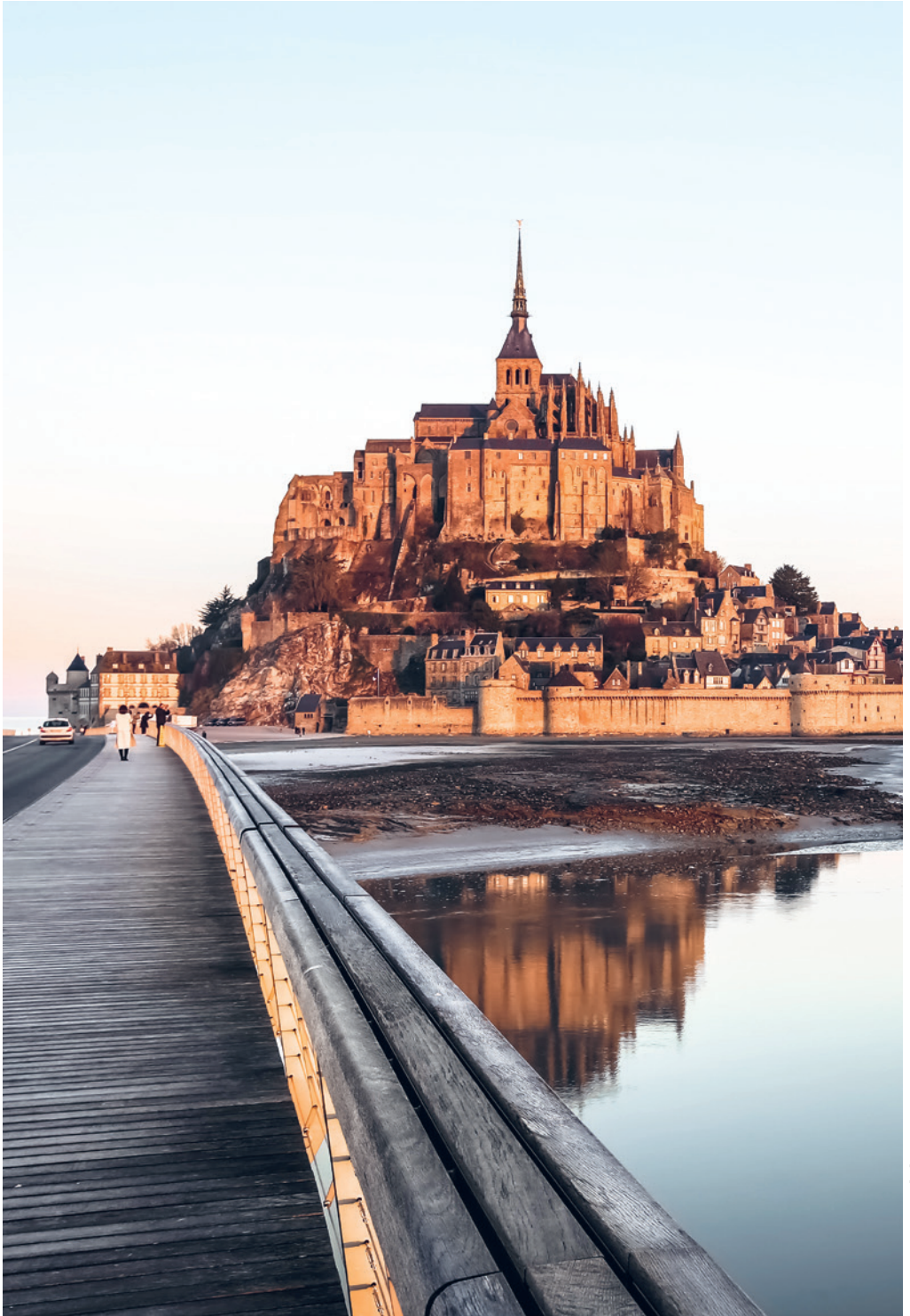
De Mont Saint-Michel