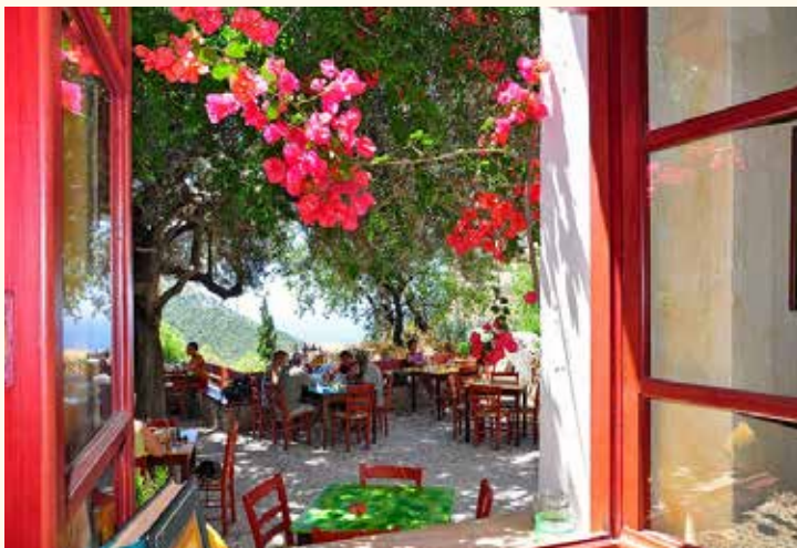
De kwaliteit van de Kretenzische tavernes is doorgaans echt goed.

Een ouzeria , ook mezedopoleia of rakadiko genoemd, is een taverne die is gespecialiseerd in kleine hapjes, mezze genaamd, die men al dan niet rijkelijk besproeid met ouzo of raki eet.