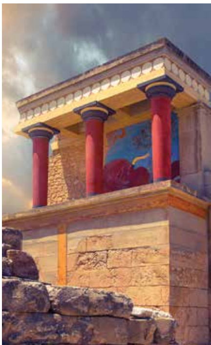
Het kleurige paleis van Knossos prikkelt de fantasie.

U kunt in elke haven opstappen, bijvoorbeeld tussen Lentas en Tsoutsouros (zie blz. 149), in Agios Nikolaos (zie blz. 162), Elounda (zie blz. 167) of Ierapetra op het eiland Chri (zie blz. 178). Als u dolfijnen wilt spotten, ga dan naar Paleochora (zie blz. 292).