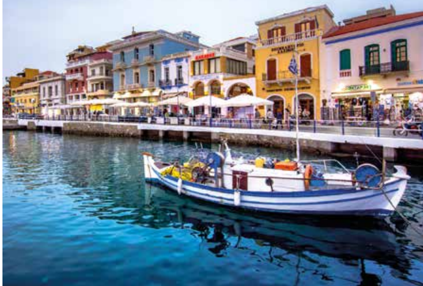
De kleurrijke gevels van Agios Nikolaos weerspiegeld in het water van de haven

geweven en geborduurde stoffen geëxposeerd. Komende vanaf het toeristenbureau begint voorbij de brug rechts de Odos 28 Oktovriou . Deze en de evenwijdig lopende Odos Roussou Koundourou vormen een voetgangersgebied en zijn de drukste winkelstraten van de stad.