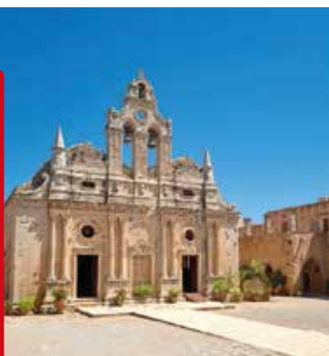
Het klooster van Arkadi in Rethymnon

♥ Strijk neer op een terras aan de Platia Venizelou , het kloppend hart van Iraklion, en kijk hoe de inwoners hun rituele avondwandelingetje maken. Ga daarna naar een van de bars in de omliggende straten, Perdikari Milatou of Titou, waar de decibels tot diep in de nacht naar buiten stromen. Zie blz. 111.