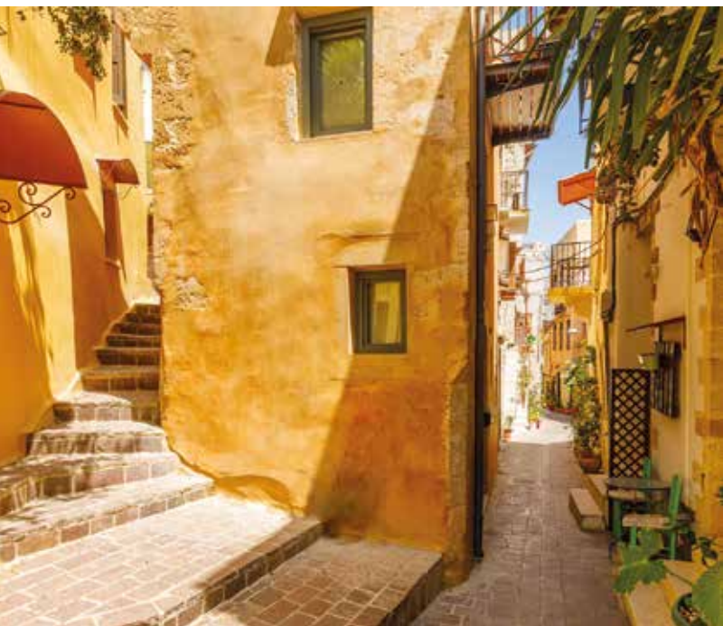
De schilderachtige straatjes van de oude stad Chania

♥ Ontdek de religieuze Kretenzische kunst in het moderne museum van de oude Agia Ekaterini in Iraklion: manuscripten, houten sculpturen en magnifieke iconen, waarvan sommige worden toegeschreven aan de Kretenzer Michalis Damaskinos. Zie blz. 114.