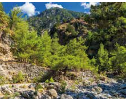
De Samariakloof, een schitterend wandelgebied

Bezoek het klooster van Gonias (blz. 278) en dat van Agia Triada (blz. 248). Overnacht in Chania.