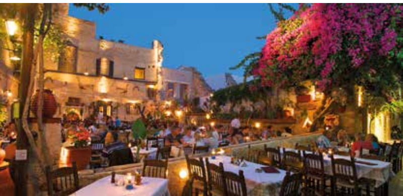
Een restaurant in het oude Chania

♥ Keer 's avonds terug naar het oude Chania , een schilderachtig labirynth waar de meest exotische geuren u tegemoetkomen, en bewonder de Moskee van de Janitsaren, de Venetiaanse arsenalen en de wijken Kasteli en Topanas. Zie blz. 238.