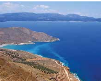
De Golf van Mirambellou

Bezoek Sitia (blz. 181) en overnacht daar ook (blz. 184).