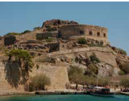
De citadel van Spinalonga F Peter Pan

► Het Natuurhistorisch Museum van Kreta. Iraklion. De opgezette dieren in deze vroegere elektriciteitscentrale komen allemaal uit het oostelijke Middellandse Zeegebied. Ze worden bewaakt door een levensgrote replica van een deinotherium, de prehistorische voorvader van de olifant en een van de grootste zoogdieren ooit. De fascinerende aardbevingssimulator is een belevenis voor jong en oud. Zie blz. 113.