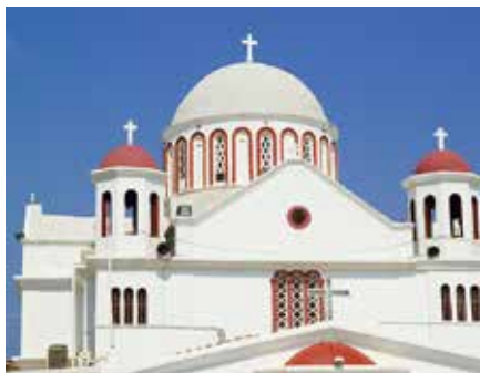
De kerk Agia Ekaterini in Sitia