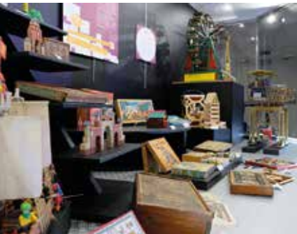
Het speelgoedmuseum in Colmar Musée du Jouet

► Brood bakken. Maison du Pain d'Alsace, Sélestat. In dit museum leren de kinderen hoe een belangrijk onderdeel van hun dagelijkse kost wordt gemaakt: brood. Ze zien de bakkers aan het werk en ruiken de heerlijke geur van versgebakken brood. Ook zijn er tientallen kleurige