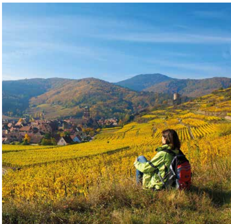
Wandelen door de wijngaarden van Thann

Tip: er lopen allerlei leuke paden en weggetjes tussen de wijngaarden door, maar in de oogsttijd worden die soms afgesloten voor toeristen.