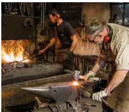
La Focale de Soultz