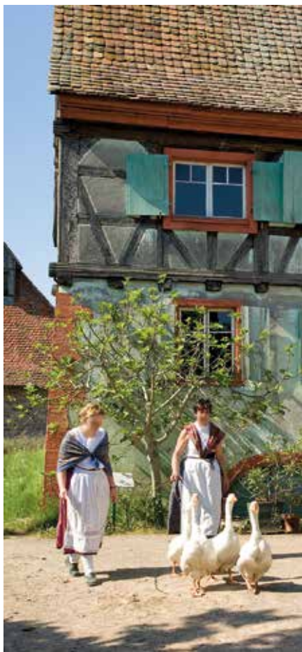
Het Écomusée d'Alsace in Ungersheim

Champ du Feu. Dit wintersportgebied in de noordelijke Vogezes is ideaal om met het hele gezin te gaan skiën of langlaufen. 's Zomers kunt u er heerlijk wandelen en mountainbiken. Het uitzicht is er altijd adembenemend! Zie blz. 181.