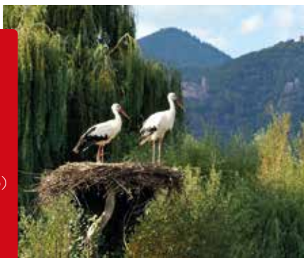
Ooievaars in het NaturOparC, in Hunawühr

♥ Eer de H. Odilia , de patrones van de Elzas, door naar het klooster op de top van de Mont Sainte-Odile te klimmen, een rots van roze zandsteen met een prachtig uitzicht op de Elzasvlakte. Zie blz. 174.