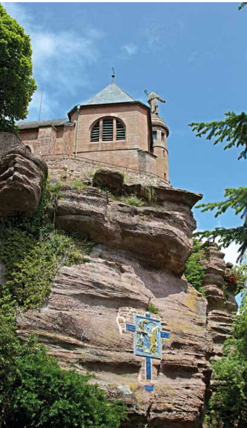
De kruisweg en de Chapelle des Rochers, op de Mont Sainte-Odile