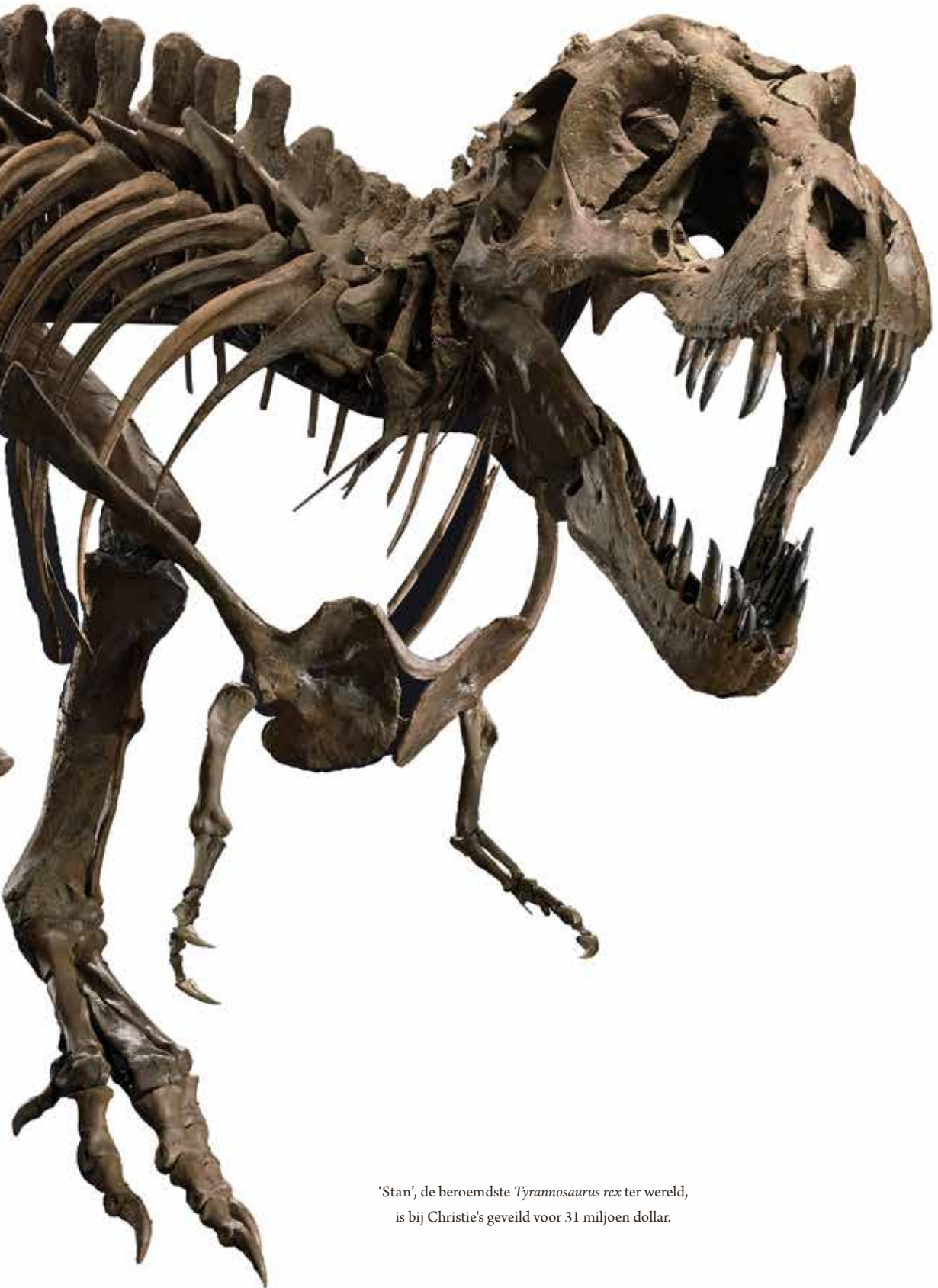
'Stan', de beroemdste Tyrannosaurus rex ter wereld, is bij Christie's geveild voor 31 miljoen dollar.