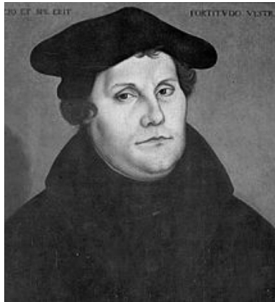
Maarten Luther geschilderd door Lucas Cranach de Oude

kon bijeenroepen. Voor Luther stond de de Bijbel boven elk menselijk gezag. Ook de Zwitserse reformator Zwingli (1484-1531) hekelde de hypocrisie van de katholieke Kerk zoals de verering van heiligen, het celibaat, de geldzucht van de geestelijke leiders, de woeker aan belastingen en het moreel schandelijke gedrag van sommige pausen en kardinalen. Zo ontstond de grote scheuring binnen het christendom waardoor zowat één derde van de toenmalige gelovigen overstapte naar het protestantisme, dat door een gebrek aan centraal gezag al snel uiteenviel in talrijke denominaties. Enkele jaren later volgde een andere scheuring. De Britse koning Hendrik VIII wou scheiden van zijn vrouw maar kreeg geen toestemming vanuit Rome. Dat leidde tot de afscheiding van de anglicaanse kerk in 1531.