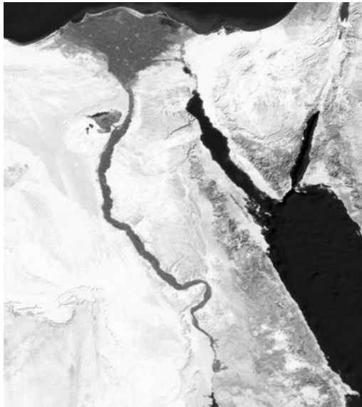
Satellietfoto van de Nijl

Egypte werd doorsneden door de Nijl, een van de langste rivieren van de wereld met een lengte van meer dan 6.000 kilometers. In een eerste stadium voerden de bewoners langs de Nijl alleen ruilverkeer met hun directe burens. Maar al snel groeide de handel tussen mensen en stammen die over een langere afstand woonden. Daarom had men ook nood aan regels die golden voor het hele Nijlgebied. Vandaar bepalingen als 'ik heb de graanmaat niet vervalst' en 'ik heb de gewichten niet vervalst'. Dergelijke normatieve bepalingen moesten zorgen voor de nodige zekerheid om handel juist mogelijk te maken. Een andere norm bepaalde dat men geen dijken of afdammingen mocht bouwen om het water van de Nijl voor de eigen landbouwgrond voor te behouden. Wie dat wel deed, onthield immers het water voor hoger of stroomafwaarts gelegen percelen die dan droog en onvruchtbaar bleven.