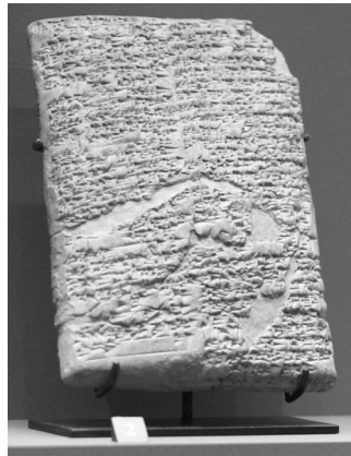
Codex Hammurabi © Musée du Louvre

bouw, het erfrecht, enzovoort, en voorzag ook gepaste straffen in geval van overtreding. Opmerkelijk zijn de gedetailleerde regels van een procesrecht, die aantonen dat men in die tijd reeds bewust was van het belang van een rechtssysteem. Rechters hadden de taak om uitspraken te doen in conflicten tussen mensen op basis van de opgelegde regels en wetten. Die wetten stonden letterlijk ‘in steen gegrift’, wat betekent dat niemand, ook de koning niet, ze kon veranderen. Alleen heel specifieke gevallen, zoals beschuldigingen van misbruik van bovennatuurlijke krachten, werden onderworpen aan een soort godsoordeel.