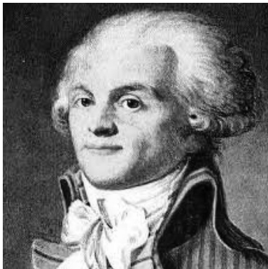
Maximilien de Robespierre (Anoniem)