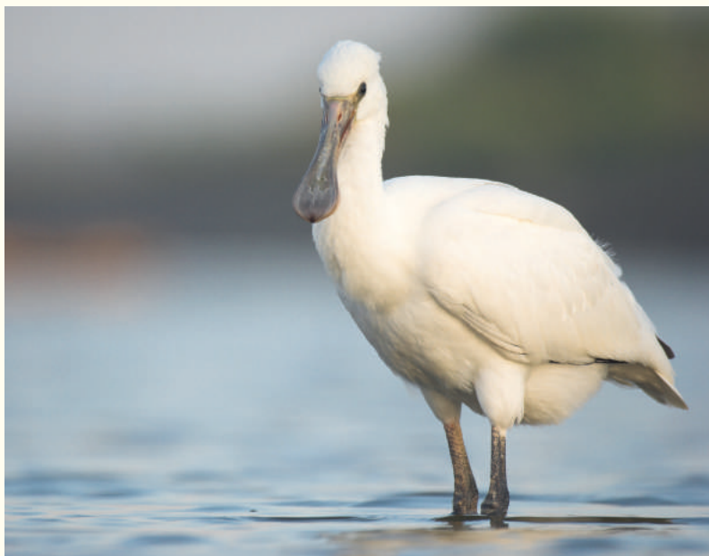
— Jeune spatule blanche