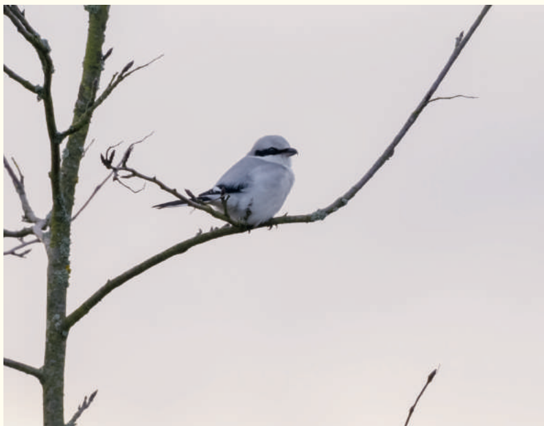
— Pie-grièche grise