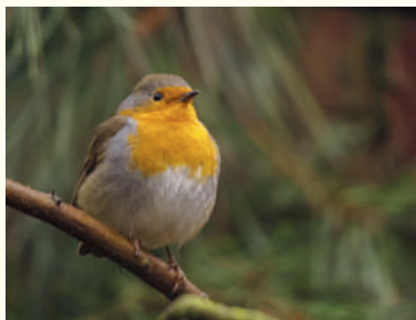
— Rougegorge familier