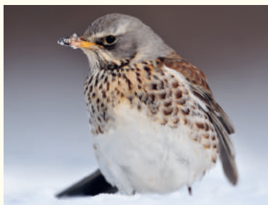
— Grive litorne