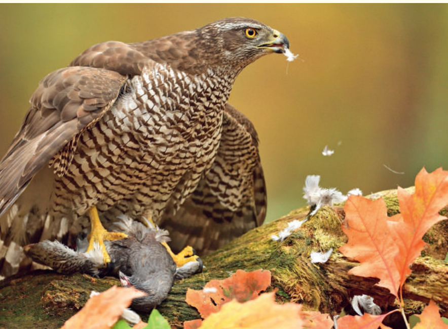
Lieu de plumaison —