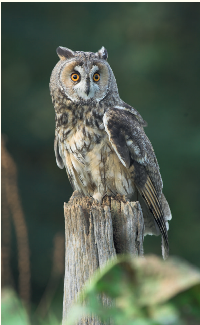
— Hibou moyen-duc