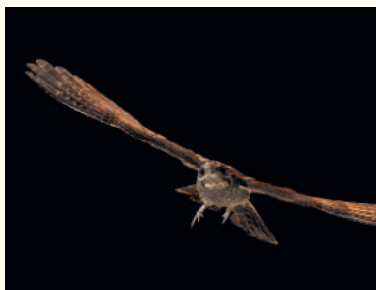
— Engoulevent d'Europe, femelle