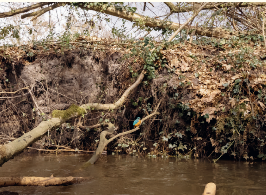
Paroi habitée par le martin-pêcheur —