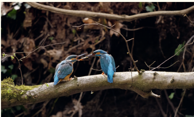
— Offrande d'une proie