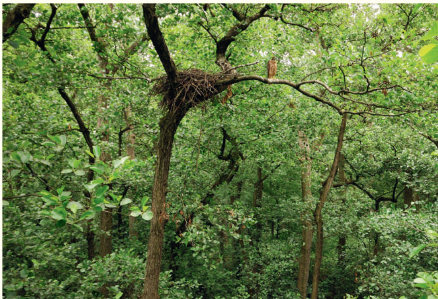
— Nid dans un arbre