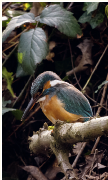
— Martin-pêcheur, femelle