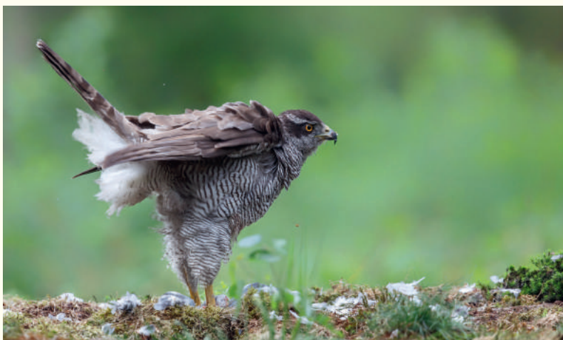
— Cet autour des palombes a des hanches avantageuses