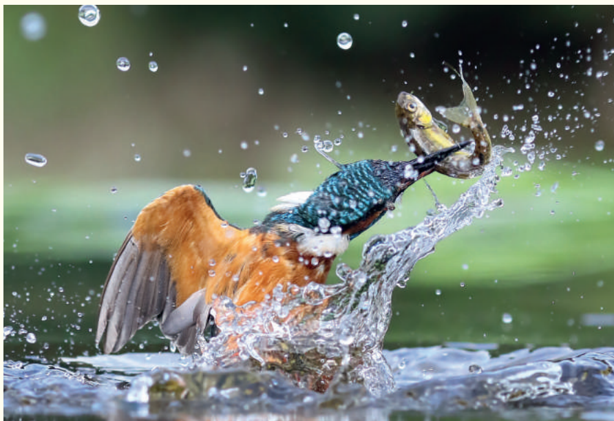
— Plongeon réussi