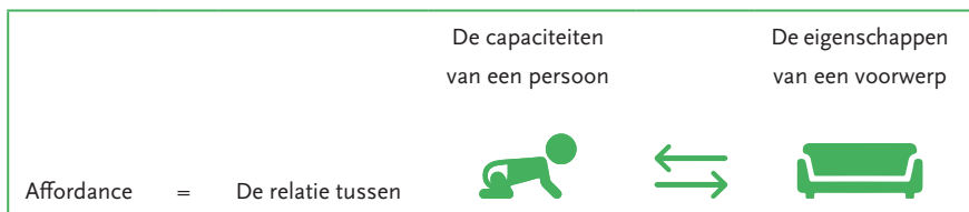
Illustratie 1.1 Omschrijving van Affordances

Het aantal affordances of mogelijkheden dat een voorwerp biedt, is een erg bruikbaar kader om tot rijk ingerichte speelplekken te komen. Dat staat centraal in hoofdstuk 4. Voorwerpen met een groter aantal affordances zijn vaak interessanter omdat ze langer en meer gevarieerde spelmogelijkheden uitlokken dan voorwerpen met één of een beperkt aantal affordances . Het verklaart waarom jonge kinderen vaak snel uitgespeeld zijn op buitenspeeltoestellen zoals een schommel of een wip (die bieden maar één spelmogelijkheid: je kunt erop schommelen of wippen), terwijl een klimboom, zand of water vaak veel langer en intenser spel uitlokt, omdat het veel meer spelmogelijkheden biedt. Het aantal mogelijkheden van voorwerpen kun je ook sterk uitbreiden via doordacht gekozen combinaties van verschillende voorwerpen. Zo zal het toevoegen van een laken aan een stoel extra mogelijkheden bieden om bijvoorbeeld een kamp te bouwen.