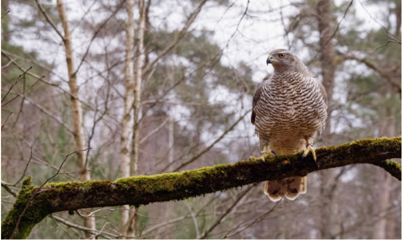
— Volwassen vogel

Dé roofvogel bij uitstek is zonder twijfel de havik: snel, sterk, behendig, meedogenloos ... deze vogel heeft het allemaal!