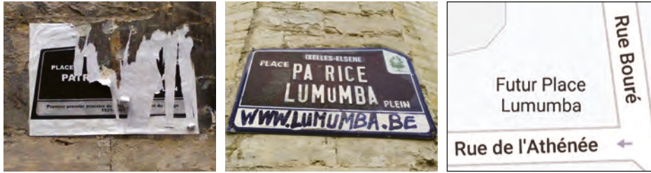
Het Lumumbaplein in Elsene bestaat alleen op officieuze straatnaambordjes en op Google Maps.