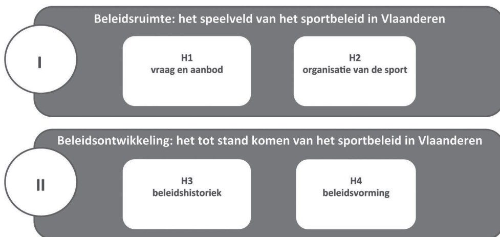
Figuur I.1 Opbouw van het boek Sport. Beleid en participatie in Vlaanderen

Het voorliggende werk is opgebouwd uit twee delen (zie Figuur I.1). In het eerste deel staat de beleidsruimte van het Vlaamse sportbeleid centraal. Meer bepaald gaan we na hoe het speelveld van het sportbeleid in Vlaanderen eruitziet. Vooreerst staan we stil bij vraag en aanbod in het Vlaamse sportlandschap, geven we een beeld van de tewerkstelling in de Vlaamse sportsector, alsook een indicatie van de economische betekenis van de sport in Vlaanderen. Vervolgens focussen we uitgebreid op de organisatie van de sport. Daarbij beschrijven we hoe en waar de Vlaamse sportsector zich in een ruimere context situeert (sportomgeving), brengen we in kaart welke spelers actief zijn (sportsector), geven we aan hoe deze actoren zich ten aanzien van