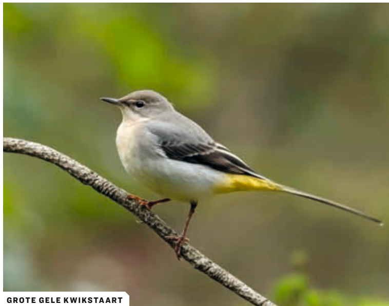
GROTE GELE KWIKSTAART