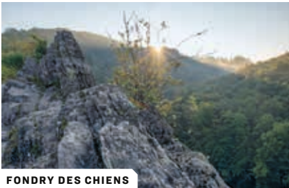
FONDRY DES CHIENS

Door deze bijzondere klimatologische en bodemkundige eigenschappen komen er in Wallonië natuurtypes voor die Vlaanderen niet of amper kent. Hier denken we aan: de ravijnbossen,