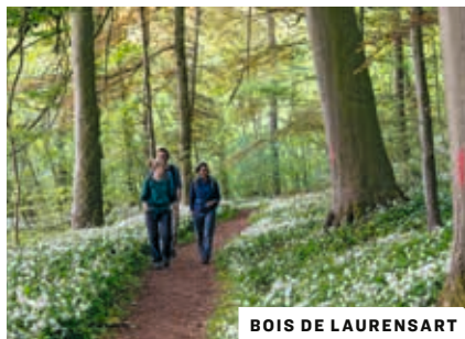
BOIS DE LAURENSART

Dit boek nodigt je uit om de natuur in Wallonië en de Ardennen te verkennen. De beschreven routes leiden je naar de mooiste plekken, maar altijd met respect voor de natuur . Daarom is het cruciaal om een aantal gedragsregels te respecteren: blijf op de aangegeven paden zodat je de natuur niet verstoort.