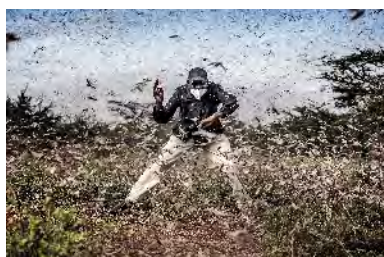
LUIS TATO Bestrijding van een sprinkhanen- plaag in Oost-Afrika