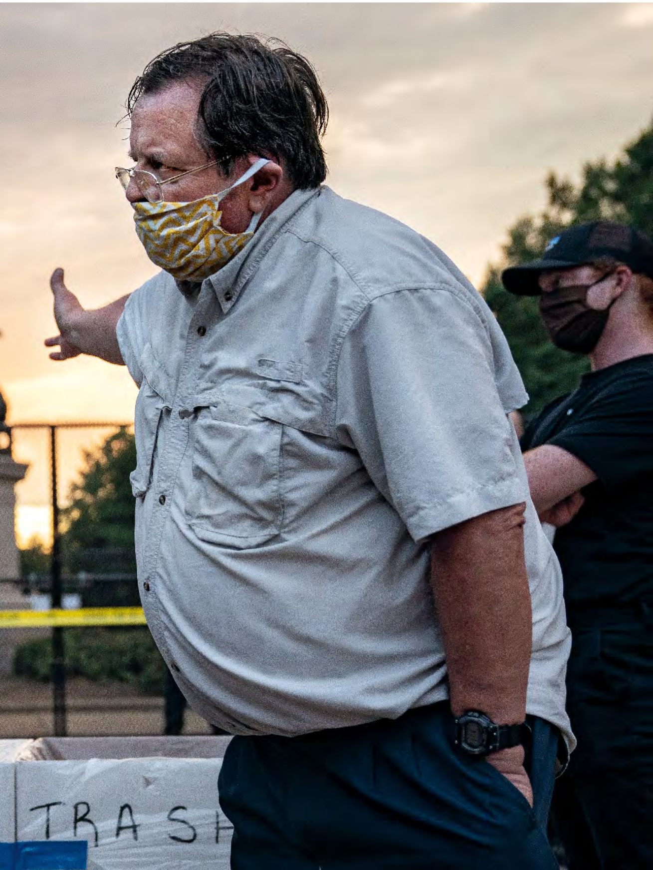
Evelyn Hockstein, Verenigde Staten, voor The Washington Post , 1ste prijs Hard nieuws