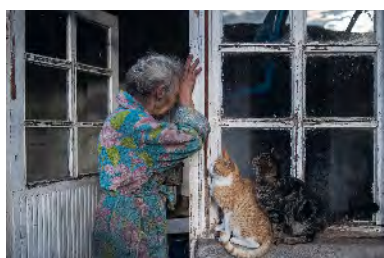
VALERY MELNIKOV Paradise Lost