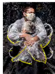
MADS NISSEN De eerste omhelzing