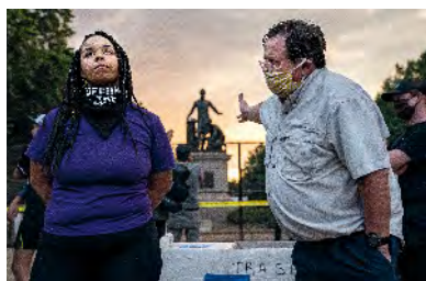
EVELYN HOCKSTEIN Discussie over emancipatiemonument