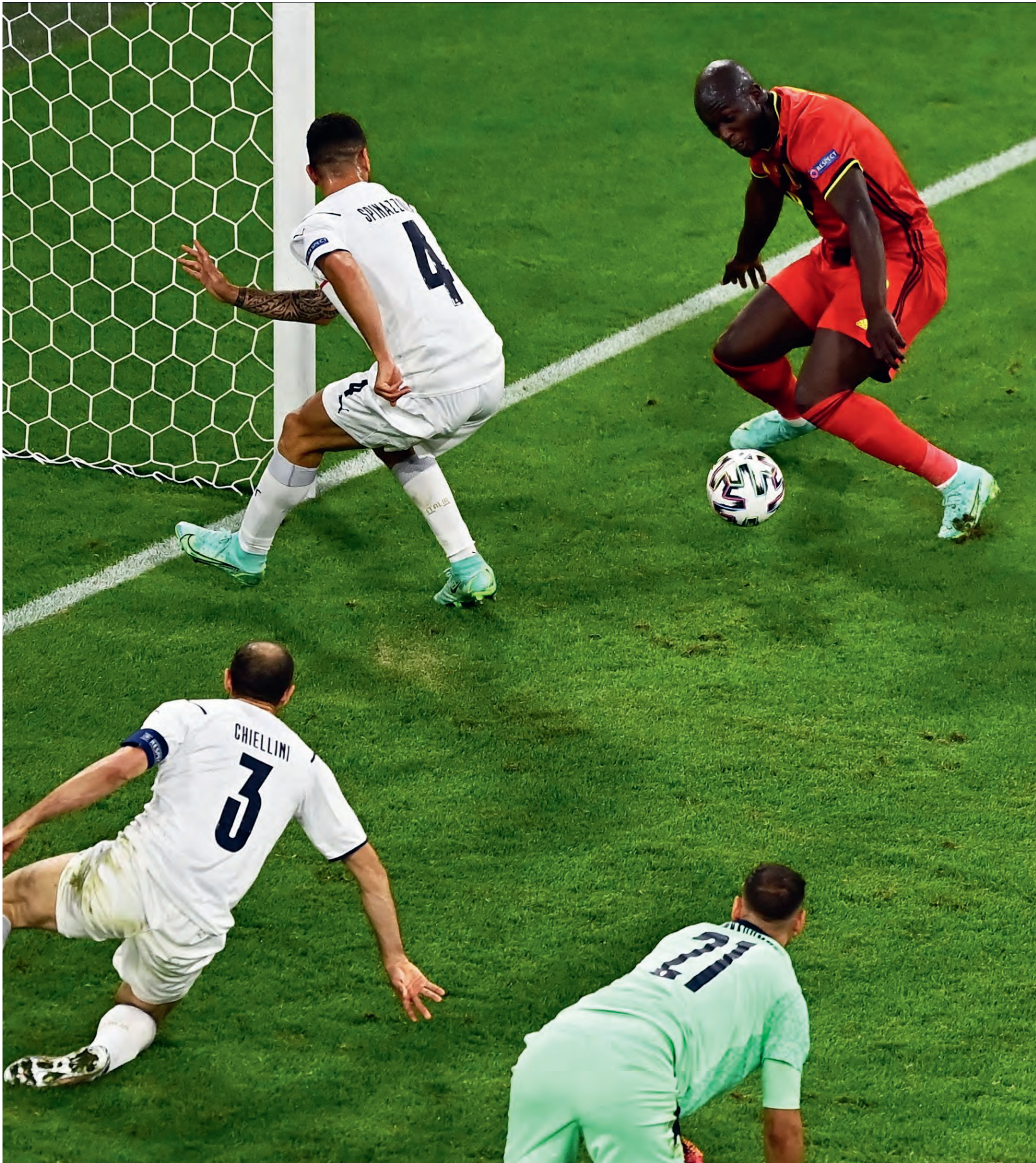
Romelu Lukaku tijdens de kwartfinale tussen België en Italië, UEFA Euro 2020