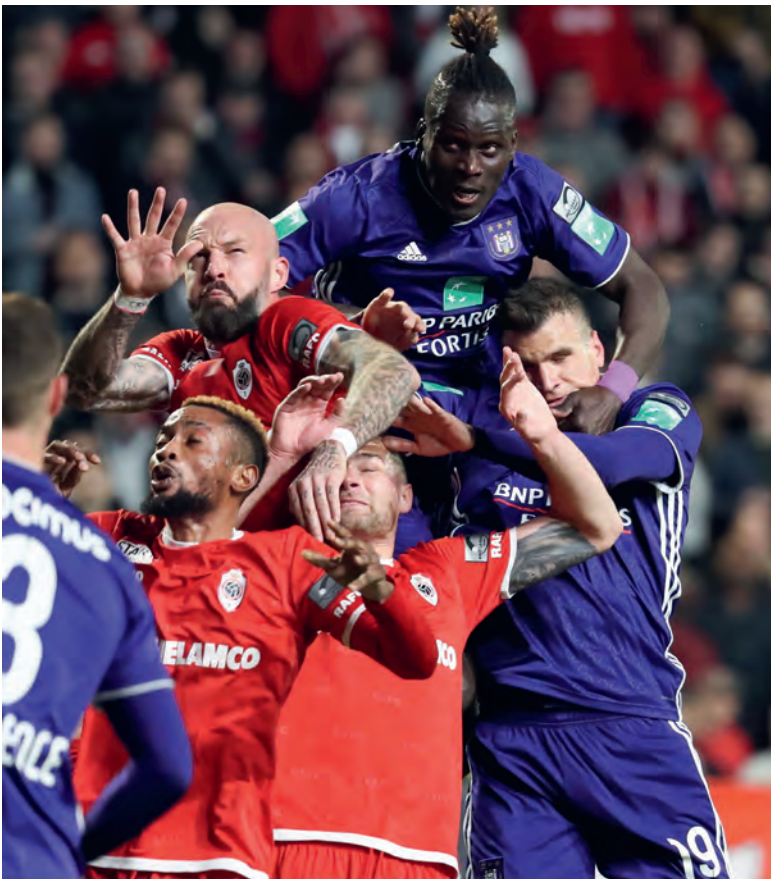
Jelle Van Damme en Kara Mbodji vechten voor de bal tijdens de match Royal Antwerp FC-RSC Anderlecht, Jupiler Pro League 2018-2019.