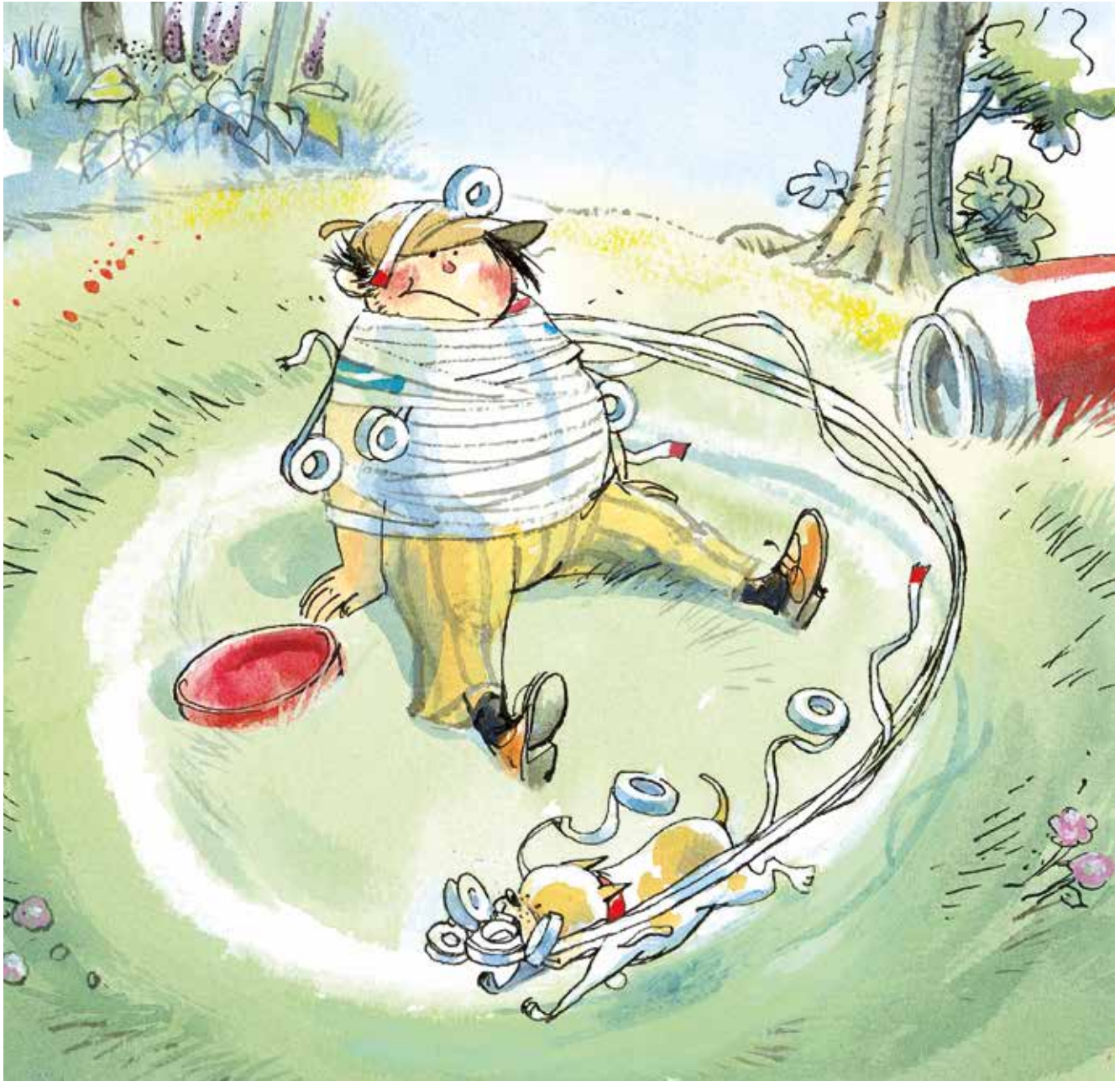
Politiehond plakt Boef stevig vast