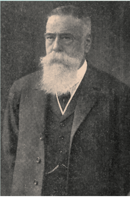
● Portret van Jules Carlier , voorzitter van het CNC van 1917 tot 1930, die tijdens de Eerste Wereldoorlog meewerkt aan de reorganisatie van de Belgische industrie in zeventien hoofdsectoren.

van de CCTI-statuten, streeft het Comité de volgende doelstellingen na: ‘Om de belangen – in de ruimste zin van het woord – van de nationale productie en van iedereen die daar in welke hoedanigheid ook bij is betrokken, onpartijdig te verdedigen; om alle kwesties die daarmee verband houden, te bestuderen, om hierover een zo volledig mogelijke documentatie te verzamelen en zo bij te dragen tot de economische expansie van het land.’ 4