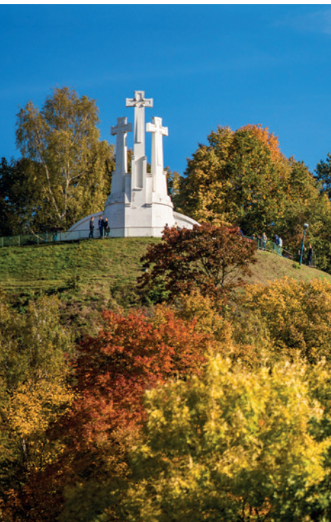
Vanaf de heuvel van de Drie Kruisen heb je een geweldig uitzicht over Vilnius.

De Baltische hoofdsteden, de koninginnen van de Oostzee , zullen je met hun harmonieuze mix van een rijk verleden, een aangrijpende politieke geschiedenis, een subtiele avant-gardistische moderniteit en een oprechte gastvrijheid weten te bekoren.