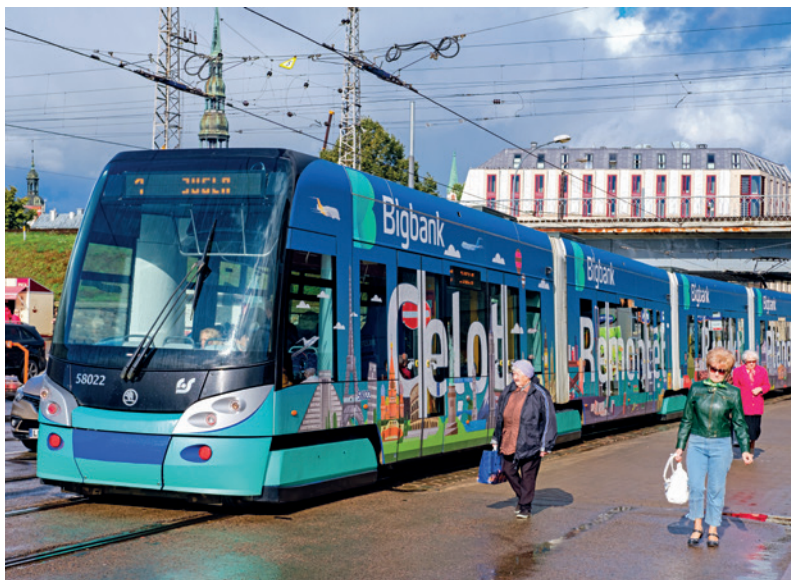
Voor grotere afstanden in de stad biedt het openbaar vervoer de ideale oplossing.