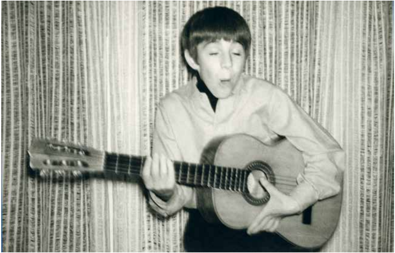
Kerst '66, in de Ardennen.