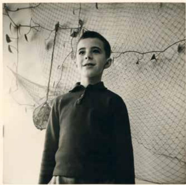
Thuis in Deurne.