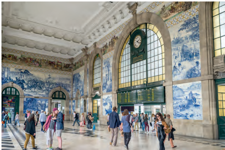
De muren van de stationshal van het Estação de São Bento zijn bekleed met azulejo's.

de avond door in het Maus Hábitos (blz. 107).