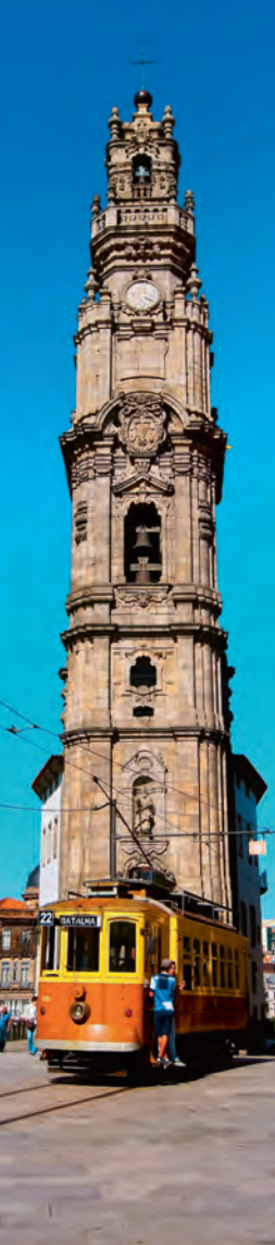
Torre dos Clérigos