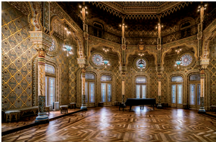
De gouden zaal in het Palácio da Bolsa doet nu dienst als concertzaal.