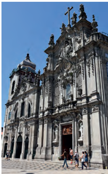
De barokke gevels van de Igreja do Carmo en de Igreja das Carmelitas

♥ Bezoek een van de portkelders in Vila Nova de Gaia en drink een glaasje port op het terras van Porto Cruz, om bij zonsondergang van het adembenemende uitzicht op Porto