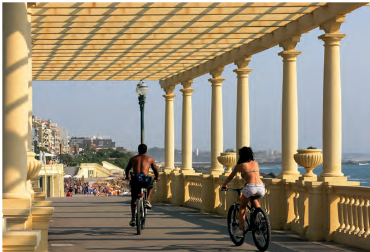
De Douro mondt uit in de Atlantische Oceaan in Foz do Douro

te genieten. De twee heuvels worden gescheiden door een klein dal, dat naar het Praça da Ribeira leidt. 🍷 blz. 63.