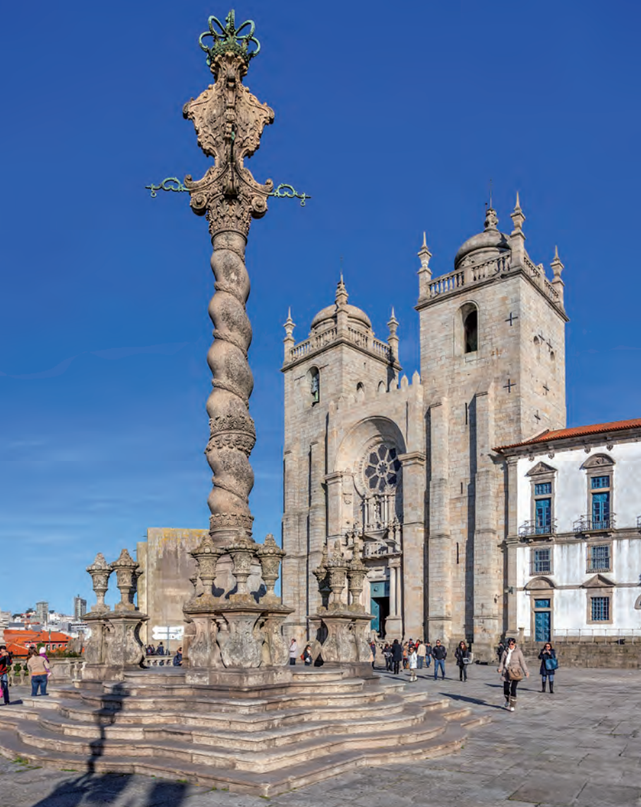
De kathedraal en schandpaal op het Terreiro da Sé