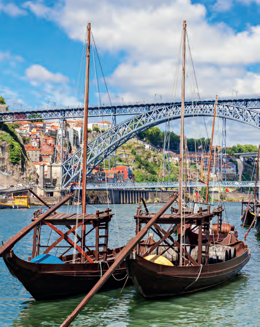
Kleurrijke rabelo's vervoeren port over de Douro.