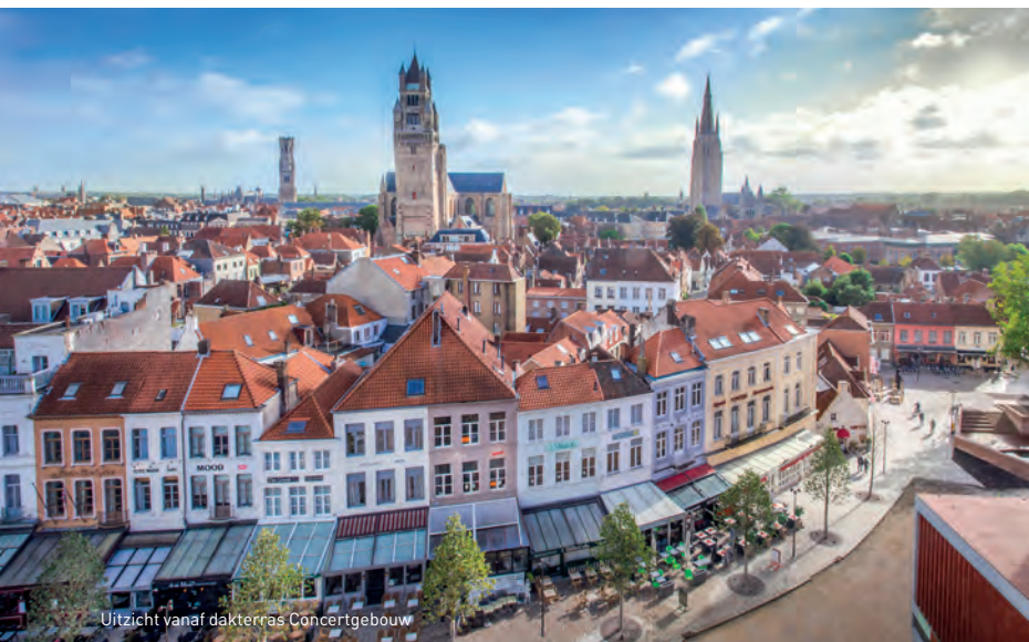
Uitzicht vanaf dakterras Concertgebouw

Brugge mag dan oprecht trots zijn op zijn werelderfgoedstatus, de stad omarmt de toekomst! Deze tocht neemt je mee langs wereldberoemde panorama's, torenhoge monumenten en eeuwenoude pleinen, opgefrist met eigentijdse constructies. Met één been in de middeleeuwen, met het andere stevig in het heden. Een absolute must voor al wie Brugge voor het eerst bezoekt en meteen het hart van de stad wil ontdekken. Houd je fotoestel klaar!