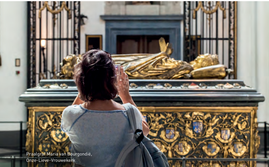
Praalgraf Maria van Bourgondië, Onze-Lieve-Vrouwekerk

Brugge telt heel wat unieke plekken die je gezien moet hebben: sfeervolle getuigen van een rijk verleden. De Vlaamse primitieven zijn beslist het Brugse paradepaardje, met onder meer het Ursulaschrijn van Hans Memling en Jan van Eycks Madonna met kanunnik Joris van der Paele . Maar ook museumliefhebbers die zin hebben in meer, worden niet ontgoocheld. Het Brugse aanbod is ronduit indrukwekkend. Van moderne beeldende kunst over de wereldberoemde Madonna met Kind van Michelangelo tot een bezoek aan het Kantencentrum.