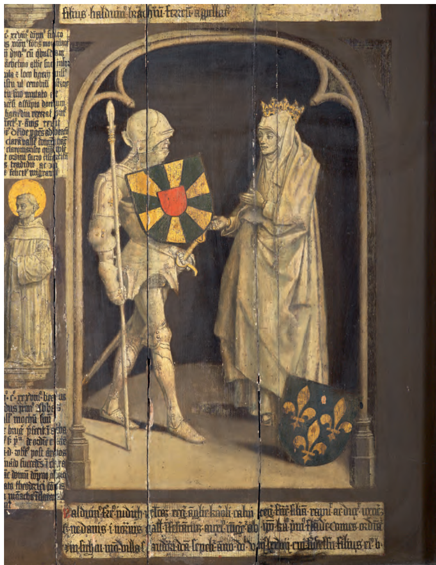
Graaf Boudewijn I en zijn echtgenote Judith. De kroon op haar hoofd benadrukt haar koninklijke afkomst. Grisaille gemaakt voor de abdij Ten Duinen, ca. 1480, nu in het Grootseminarie te Brugge.

zal toestaan om beneden haar stand te trouwen en beraamt een ontsnapingsplan. Broer Lodewijk zit mee in het complot en geeft hen zijn zegen. De prinses hult zich in een vermomming en het koppel slaat op de vlucht. Karel de Kale is ziedend. De Franse bisschoppen beschuldigen Boudewijn van ontvoering en slaan het paar in de ban van de kerk.