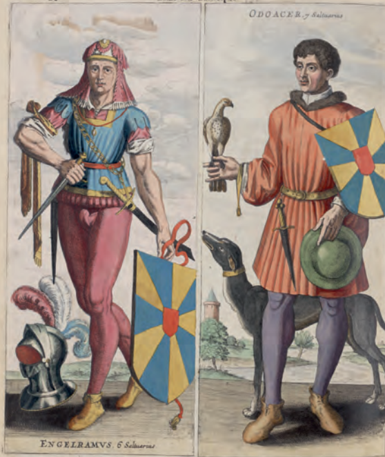
ENGELRAMVS 6 Saluaris