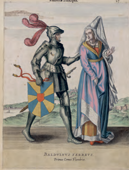
BALDWINVS FERREVS. Primus Comes Flandria.

Cap. 11. Bolonienſem. Uocem illi à Odogetoſis fuiſſe. Auſtina Comitis Sancti Pauli filium. Hancum & alii. Topuſche ſunt à Audacum filium. Adm Flandria Principem circa annum 834, cumque per annos tredecim magna preſentia & fortitudinis laude ſibi præſtitiſſet, anno 837 pharibon occiſus & in D. Saluaris (interſurgere plene) apud Hainbocum non cum patre & avo ſummatim eſt. Anſe. In opulenti penſa ſecuritate Flandriam Principem, quos ad Comitem timido ſeruo, à reu Catholici terrarum, Paticio, & Vicario Re- gan Gallia fuiſſe controdac. Poſt Saluaris illor, nunciantur complures huius Provincia Comites inter quos, ſi Anſaſto forte evolutis, paucoſ regnes, qui non faceret illor, admodum, de magna Principes, & apud nos confidit vocant modo acceptum diſtinctionem, ſed magis oportet etiam accerunt. Et quod magis mireris, obtinuit partem coringis partem vitæ, & pſentis ſeruo, quæ ſeruo ſeruo de ſeruo Principem & pſentis quæ eſt regio Hiſpania, totaque alia Regna, Imperia, Dynaſtia, atque Provincia. Odoacer autem filium ſuis