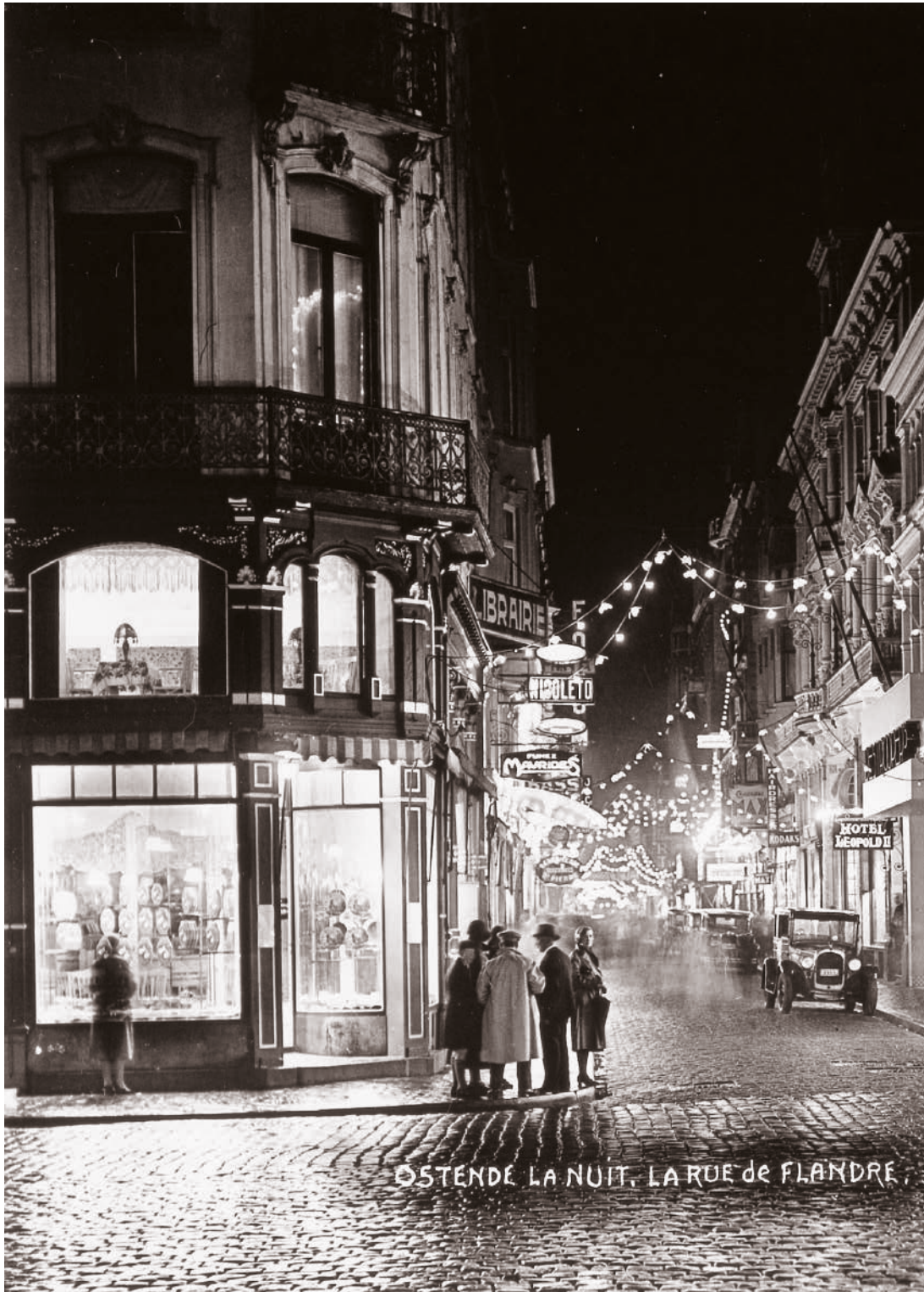
OSTENDE LA NUIT, LA RUE de FLANDRE