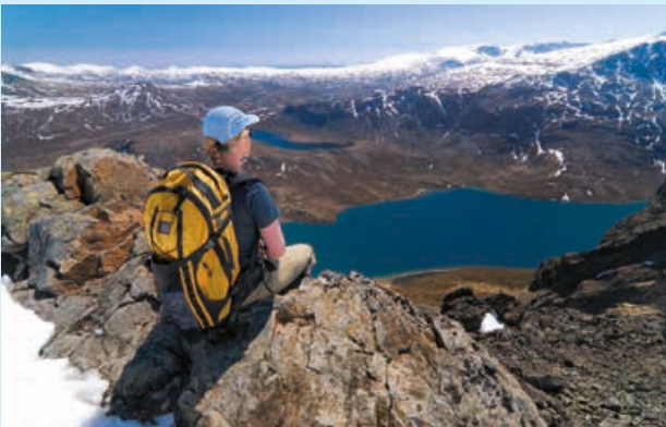
◀ Vogelperspectief: wandelen in het nationaal park Jotunheimen, het 'huis van de reuzen'

Den Norske Turistforening (DNT) , Youngstorget 1, 0181 Oslo, T 40 00 18 70, www.dnt.no .