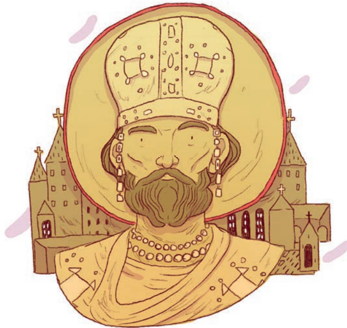
David De Bouwer

Als spionnen samenwerken om samen een land of een leider te dienen, vormen ze een inlichtingendienst, ook wel een geheime dienst genoemd omdat spionnen geheime opdrachten krijgen. De eerste geheime dienst vormde zich in de 12de eeuw en werkte voor David De Bouwer , de koning van het vroegere Georgische Rijk in Oost-Europa. De geheim agenten kregen de naam mstovaris , het oude Georgische woord voor 'spionnen'. Ze waren experts in het vinden van samenzweerdere, het ontmaskeren van andere spionnen en het binnendringen in kastelen, burchten en paleizen. Het maakte van David De Bouwer een van de machtigste leiders van zijn tijd.