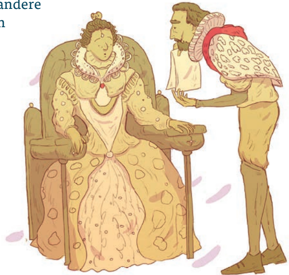
Elizabeth I en Francis Walsingham

Walsingham was niet zomaar een topspion: hij had geheim agenten over heel Europa en ver daarbuiten. Niemand anders had zo veel spionnen. Hij betaalde hen grote sommen geld om hem zowel gewoon nieuws als geheimen te bezorgen. Walsingham wordt dan ook beschouwd als de oprichter van de moderne spionage.