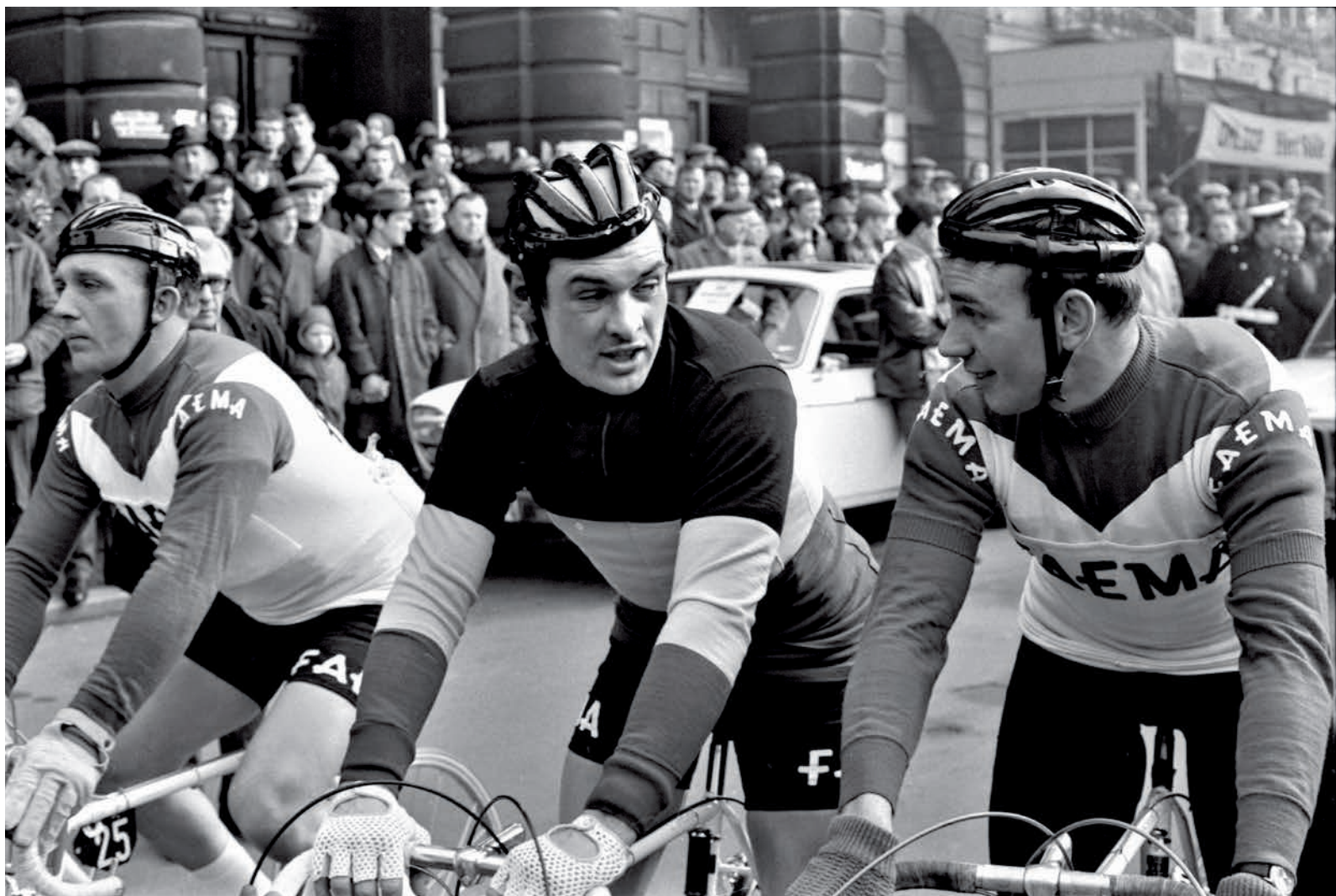
Driessens' opgedoekte Smiths-ploeg versterkt Merckx' Faema-team met Frans Brands, Julien Stevens, Georges Vandenberghe en Valère Vansweevelt.