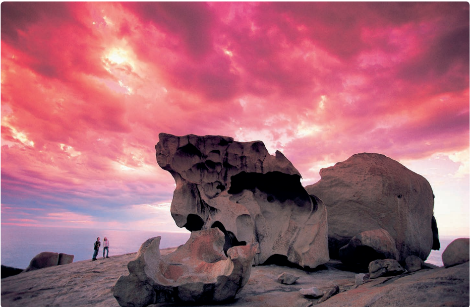
▼ Flinders Chase National Park beslaat het hele westelijke deel van Kangaroo Island (South Australia)

Doorslaggevend in de discussie was de rechtszaak die vijf eilandbewoners uit Torres Strait onder leiding van Eddie Mabo in 1982 voor het eerst voor het Australische Hooggerechtshof aanspanden en waarbij ze landrechten eisten voor de Murray Islands voor de kust van Queensland. In 1992 kende het Australische Hooggerechtshof de Aboriginals voor de eerste keer landrechten toe. Het is echter nog altijd bijzonder moeilijk die in de praktijk te laten gelden, vooral wanneer de economische belangen van de grote mijnbouwbedrijven mee-