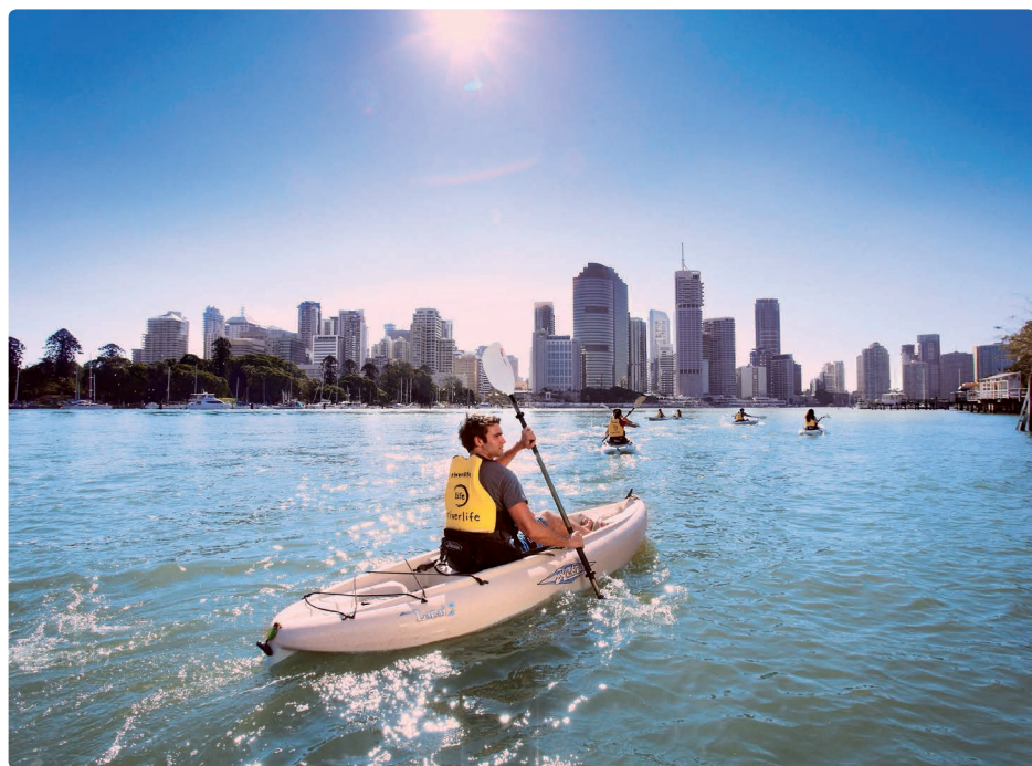
▲ 'Canoeing' met uitzicht op de skyline van Brisbane

pubs, cafés en restaurants. Hobbykoks moeten zeker een kijkje gaan nemen op de James Street Market , met talloze gespecialiseerde kramen en winkels in alles wat met eten en drinken heeft te maken. Leuk voor iedereen is een bezoek aan de zaterdagse Brisbane Valley Market ; elk weekend is er ook een kleurrijke markt in Southbank, in Grey Street.