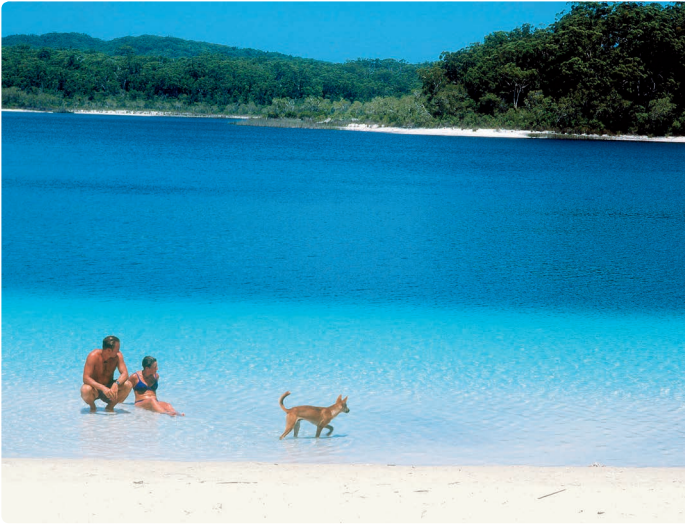
◀ Fraser Island – het grootste zandeiland ter wereld (Queensland)

Doorslaggevend in de discussie was de rechtszaak die vijf eilandbewoners uit Torres Strait onder leiding van Eddie Mabo in 1982 voor het eerst voor het Australische Hooggerechtshof aanspanden en waarbij ze landrechten eisten voor de Murray Islands voor de kust van Queensland. In 1992 kende het Australische Hooggerechtshof de Aboriginals voor de eerste keer landrechten toe. Het is echter nog altijd bijzonder moeilijk die in de praktijk te laten gelden, vooral wanneer de economische belangen van de grote mijnbouwbedrijven mee-