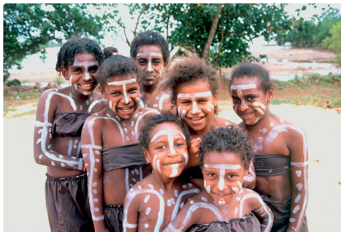
► Aboriginalkinderen van Cape York, de meest noordelijke regio van het Australische continent (Queensland)

In de juridische strijd tussen de blanken en de Aboriginals speelt het begrip terra nullius een belangrijke rol. Tot voor enkele jaren konden de Australiërs de legende van het Niemandsland en rechtmatig toegeëigend land nog hard maken, terwijl de Aboriginals zich bleven beroepen op hun landrechten. Zelfs al kennen ze geen eigendomsrecht in de westerse zin van het woord, toch zijn volgens hen de landrechten die ze ontlenen aan hun eeuwenoude verbondenheid met het land gelijk te stellen met eigendomsrechten.