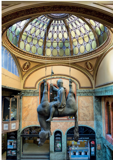
Het beeld van de heilige Wenceslas, een werk van David Cerny, in de Lucernapassage

volg de vestingwallen naar de ingang van de tuinen onder de Burcht★★★ (blz. 56), die u doorkruist om ook in de benedenstad aan te belanden. U verlaat het domein via een oud paleis van Malá Strana. Lunch in de wijk.