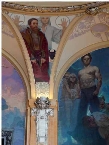
Bewonder de decoratie in secessionstijl van het Representatiehuis.

Dit huis dankt zijn naam aan het beeldje van de Heilige Maagd dat een van de gevels siert. Dit is het enige