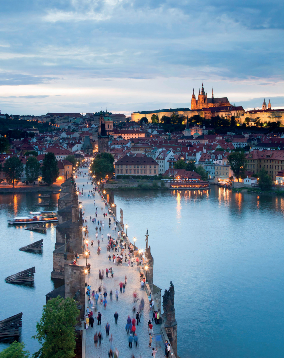
De Karelsbrug met aan de horizon de Praagse Burcht