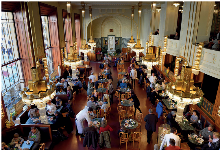
In het Representatiehuis bevindt zich een gezellig café.