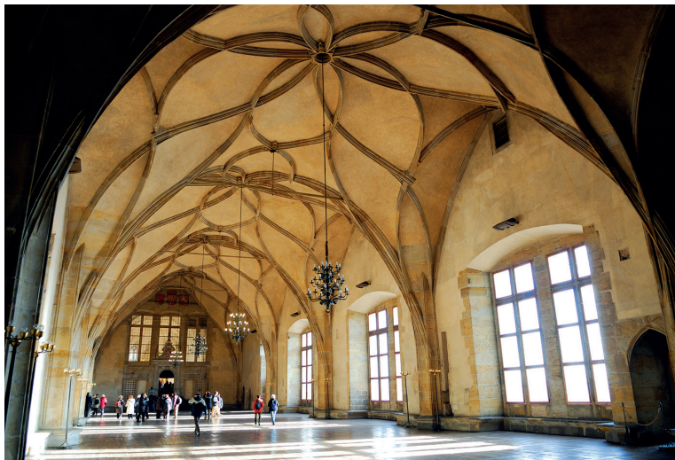
De Wladislawzaal in het voormalig Koninklijk Paleis

andere schilders uit het noorden, zoals Bruegel en Dürer. De werken die hij niet in handen kon krijgen, liet Rudolf kopiëren. Zo zorgde Joseph Heintz de Oude voor een reeks kopieën van Titiaan. In 1590 werd de Praagse School opgericht rond de schilders von Aachen, Spranger (1546-1611) en Heintz , de beeldhouwer Adriaen de Vries (ca. 1560-1626) en de Milanees Giuseppe Arcimboldo (1527-1593), beroemd om zijn portretten samengesteld uit fruit, bloemen, groenten enzovoort.