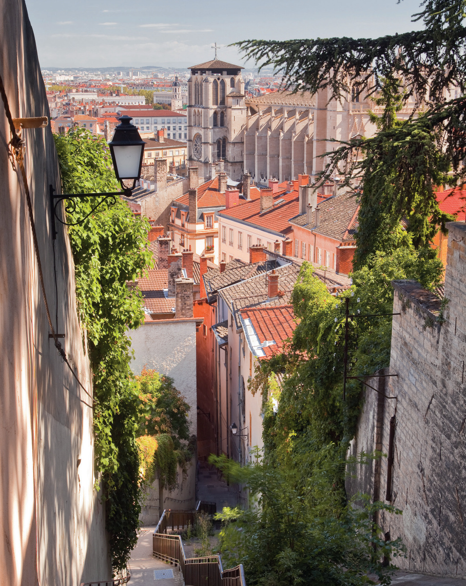
Vanaf het hooggelegen Fourvière kijkt u uit op de kathedraal Saint-Jean.