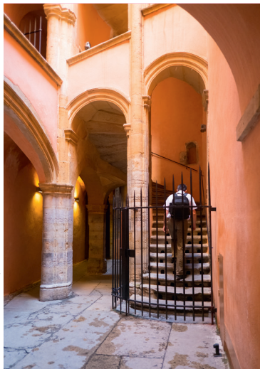
Een typische traboules in Vieux-Lyon

♥ Neem de 'ficelle' (kabeltramspoor) naar Fourvière. Dankzij die oude