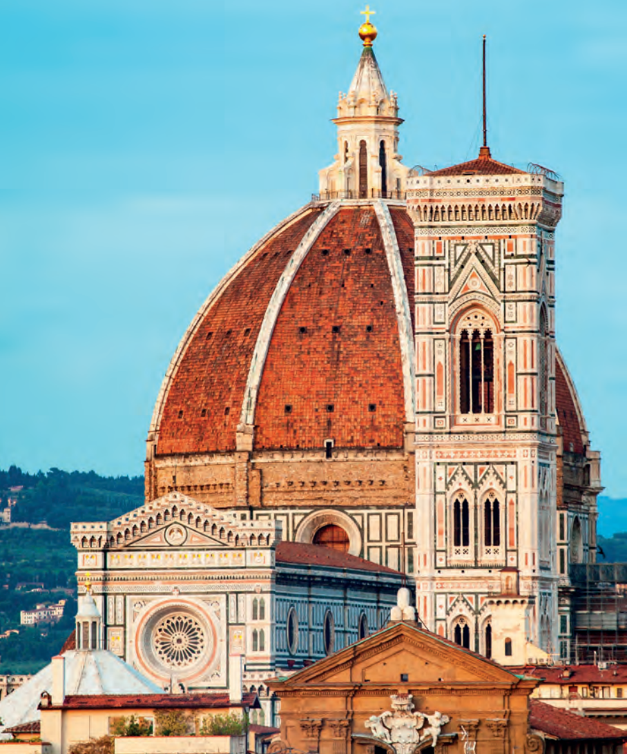
De prachtige koepel van de Duomo, een ontwerp van Brunelleschi