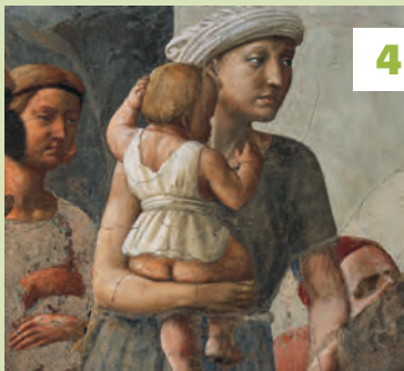
Cappella Brancacci★★★ Vouwkaart C5 - blz. 83