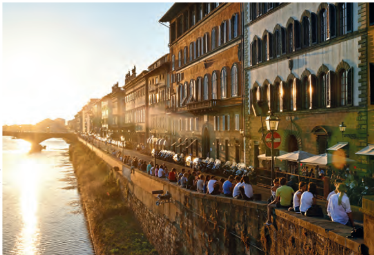
De Lungarno Vespucci bij zonsondergang

de Florentijnse high society uit de 14de eeuw. 📍 blz. 51.