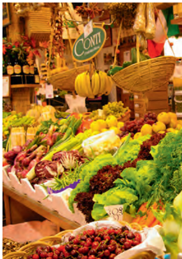
De groente- en fruitkramen in de Mercato Centrale zorgen voor een prachtig kleurenspeel.

♥ Volg een kookles in de Mercato Centrale. Tussen de stalletjes vol heerlijke geuren en prachtige kleuren