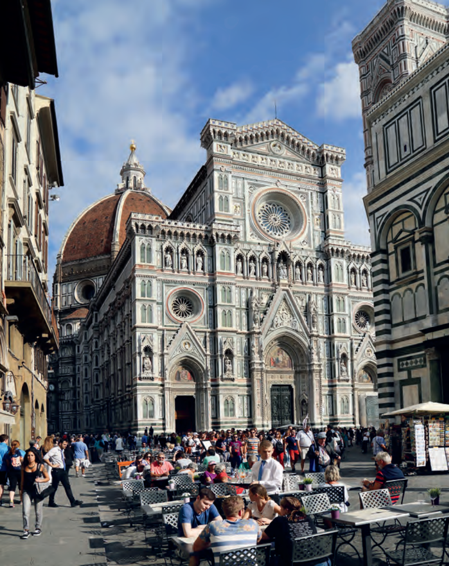
Bewonder vanaf een terras de prachtige voorgevel van de Duomo.