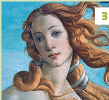
Galleria degli Uffizi★★★ Vouwkaart E5 - blz. 42