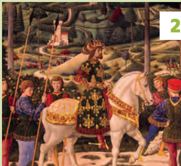
De Cappella dei Magi★★★ in het Palazzo Medici Riccardi Vouwkaart E4 - blz. 59