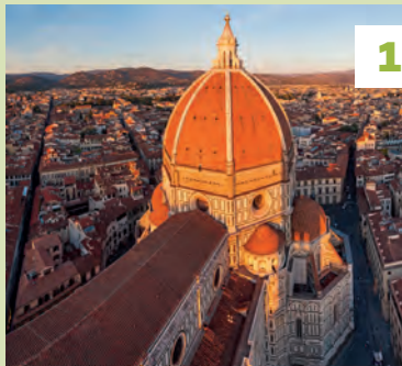
Het complex van de Duomo★★★ Vouwkaart E4 - blz. 30