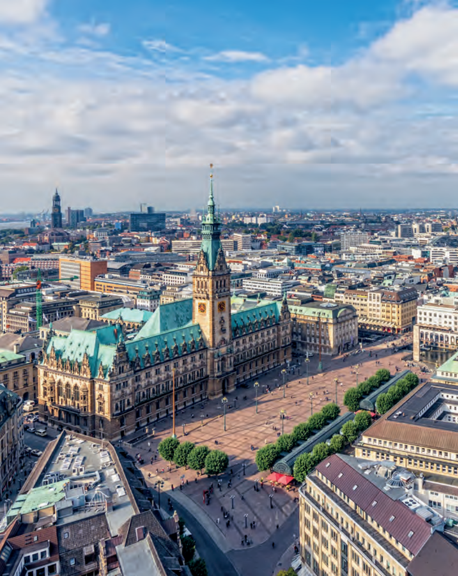
De Rathausmarkt vanuit de lucht: dit is het hart van de stad.