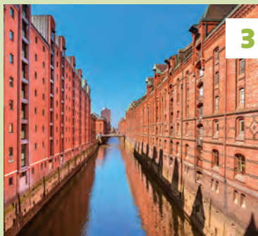
Speicherstadt ★★ Vouwkaart E67 - 🚶 blz. 45