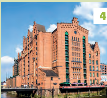
Internationales Maritimes Museum ★★ Vouwkaart G7 - 🚶 blz. 48