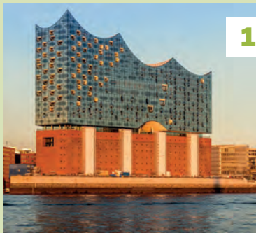
Elbphilharmonie ★★★ Vouwkaart E7 - 🚶 blz. 50