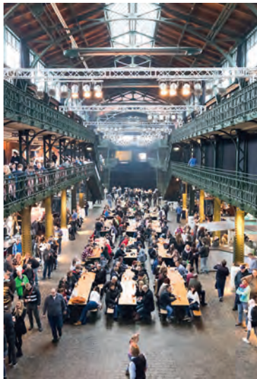
De vismarkt van Sankt Pauli

♥ De vlaggen met doodshoofden zien wapperen en de doelpunten toejuichen op Song 2 in de Südtribüne van het Millerntor-Stadion van Sankt Pauli