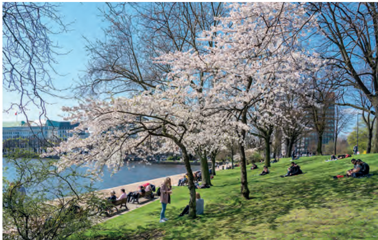
Langs de oevers van het Alstermeer