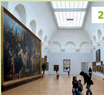
Hamburger Kunsthalle ★★★ Vouwkaart G5 - 🚶 blz. 37