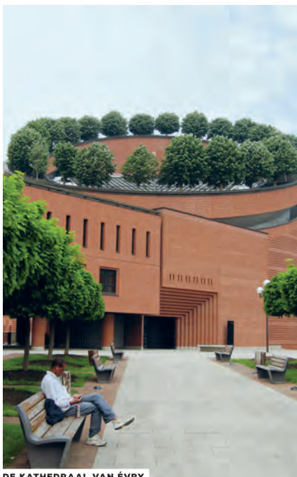
DE KATHEDRAAL VAN ÉVRY

We zetten onze koffer aan de balie van het Hôtel Napoléon. Natuurlijk is de gastheer niet thuis.