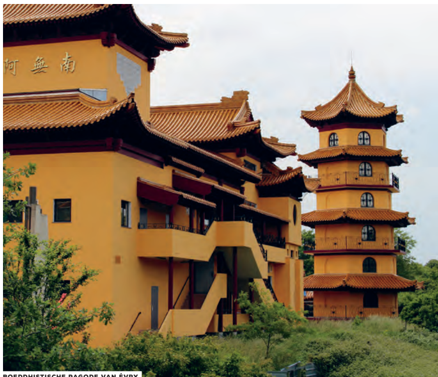
BOEDDHISTISCHE PAGODE VAN ÉVRY

In Ris-Orangis meldt een bord langs de weg ons dat we de Écoute-s'il-pleut oversteken – wat een romantische naam voor een banaal kanaal dat regenwater afvoert. Pas in Chailly-en-Bière , op een 50 kilometer van ons vertrekpunt, hebben we echt het gevoel dat we Parijs achter ons laten. Hier maken ze reclame