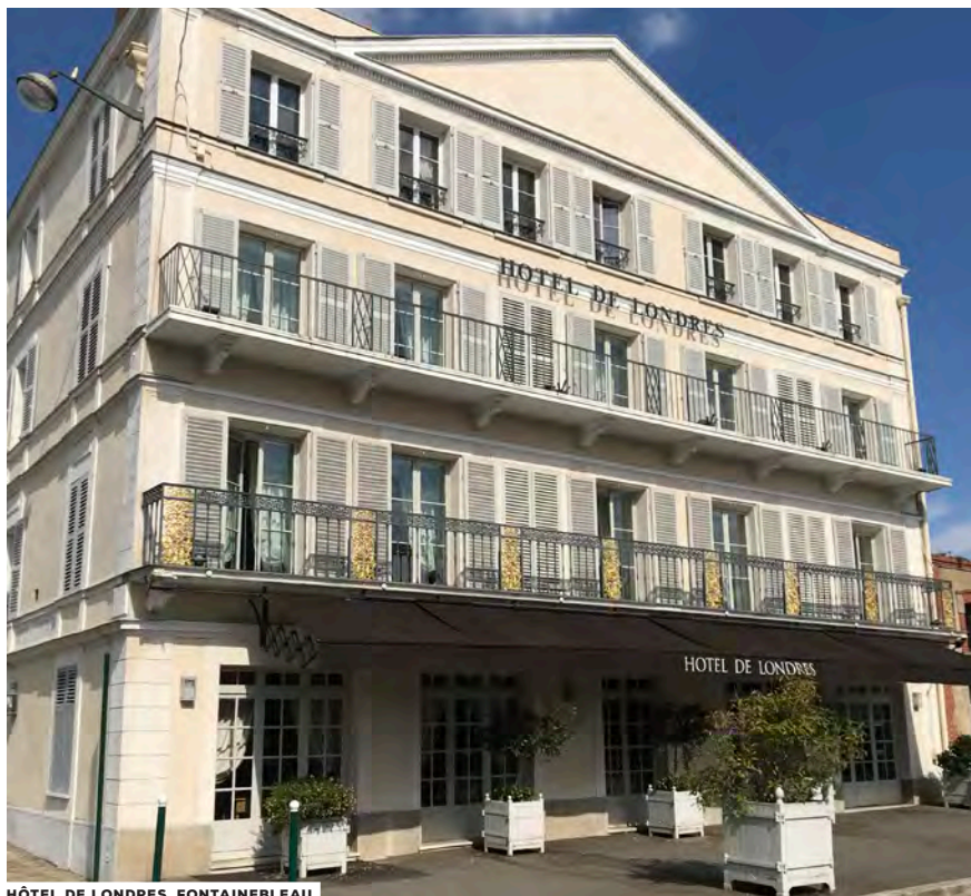
HÔTEL DE LONDRES, FONTAINEBLEAU