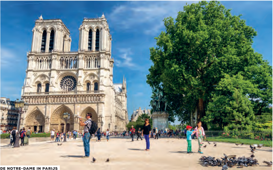
DE NOTRE-DAME IN PARIJS

Wie de namen van de andere stadspoorten van Parijs kent, weet dat de Porte d'Italie de enige is die de belofte van vakantie, zon en zee uitdraagt. De andere klinken veel prozaïscher: Porte de Clignancourt, de Bagnole, de Vanves, de Saint-Cloud. Ze getuigen niet van ambitie – dat zijn gewoon de namen van de slaapsteden die net voorbij de 'stadspoor' liggen. Italië, dat is tenminste exotisch ver weg.