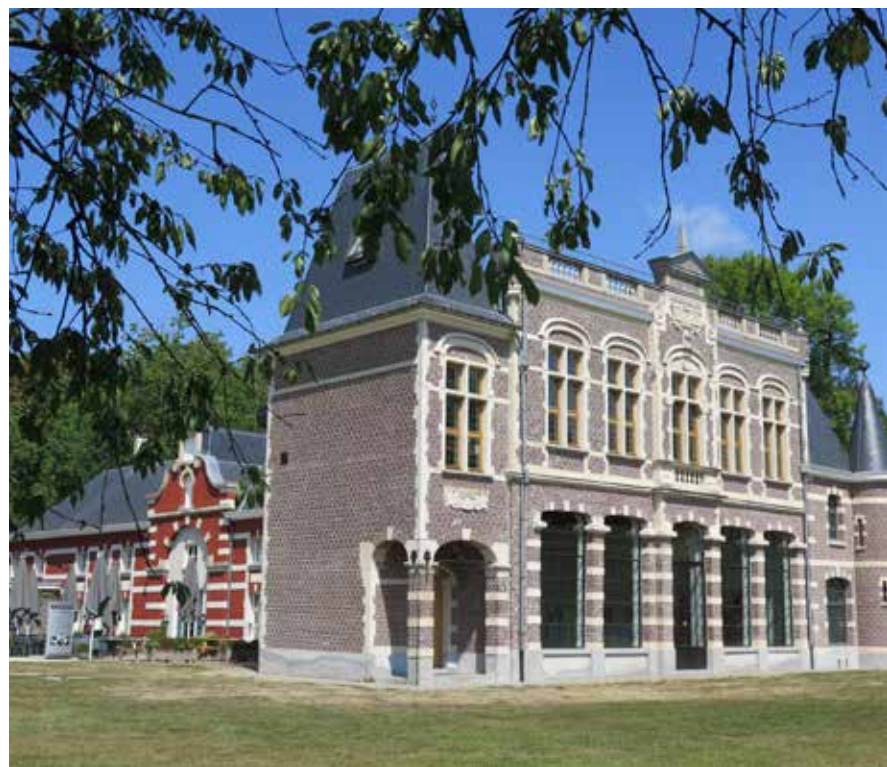
Domein de Ghellinck

→ Domein de Ghellinck, Kortrijkstraat 74 - 9790 Wortegem-Petegem www.domeindeghellinck.be