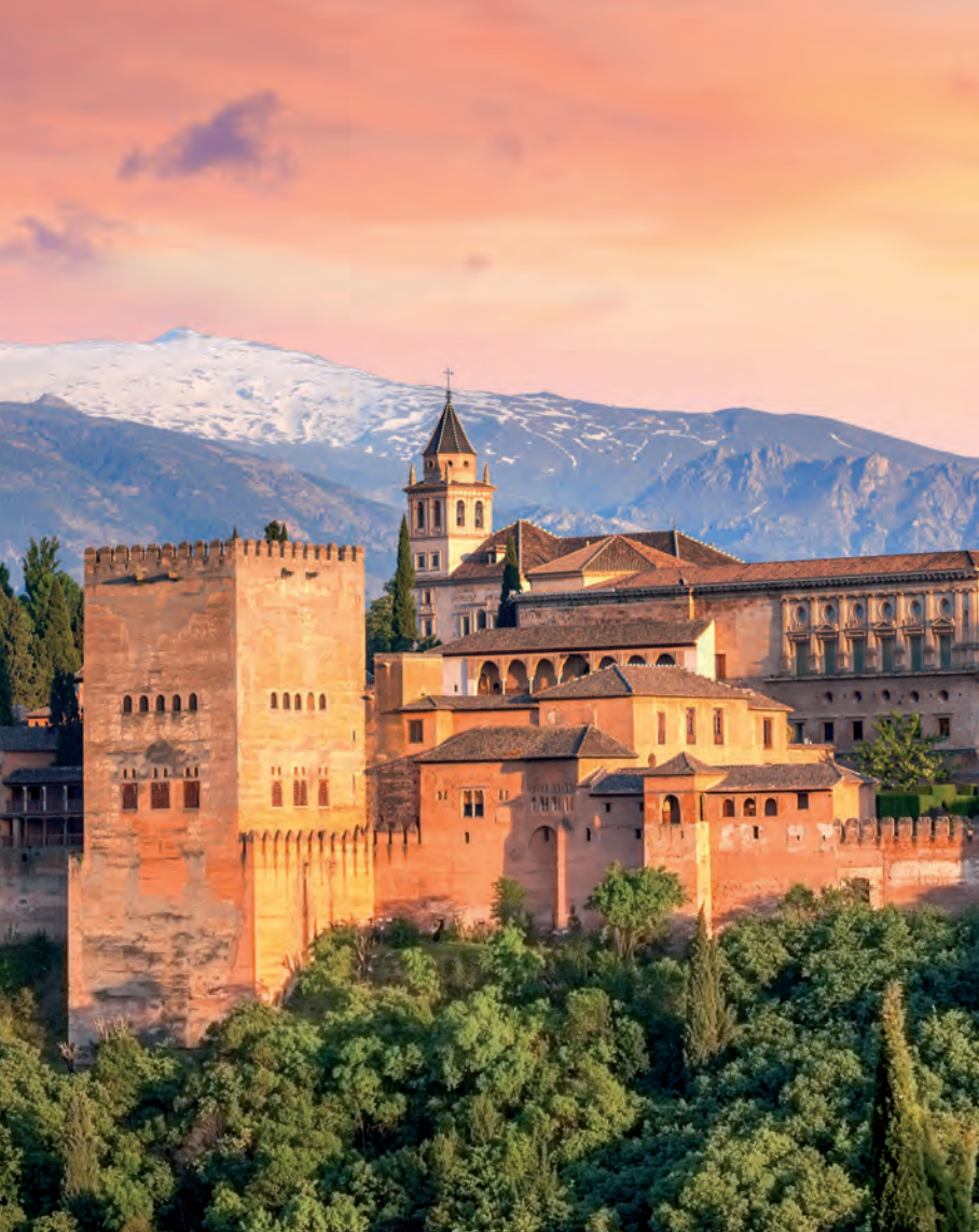
Het Alhambra met op de achtergrond de Sierra Nevada