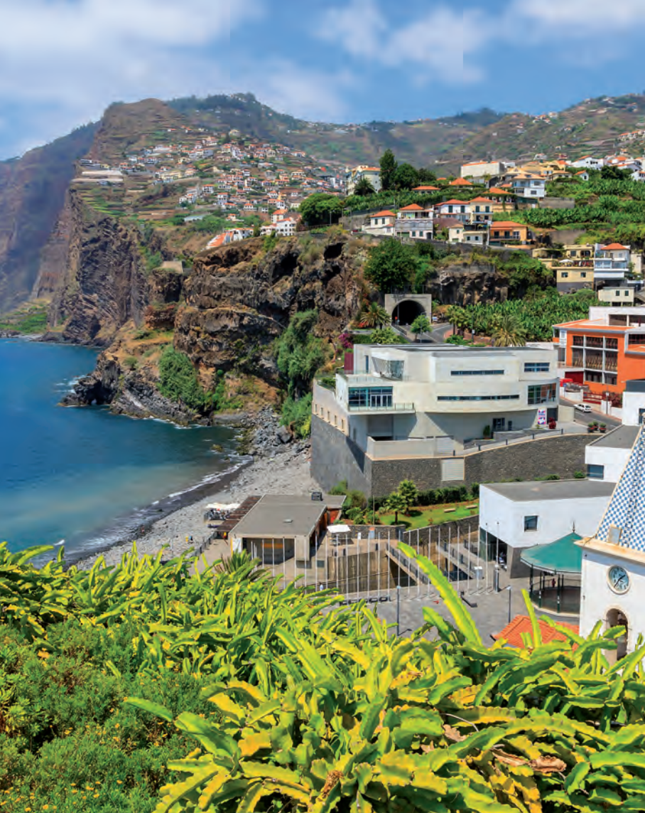
Kaap Girão, met op de voorgrond Câmara de Lobos