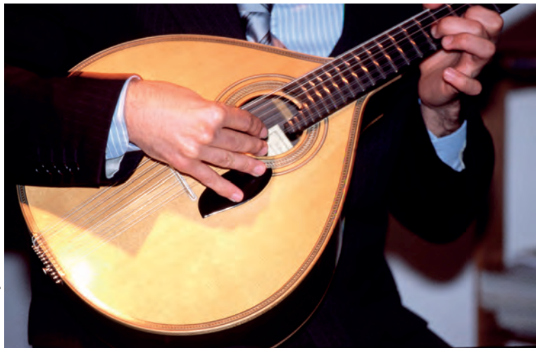
Een fadospeler brengt zijn lied op een traditionele Portugese gitaar.

♥ Ploeteren in de zwembaden van Porto Moniz . Wanneer het heel warm