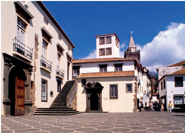
Het historisch centrum van Funchal