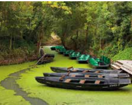
Maillezais, de Embarcadère de l'Abbaye

Route: een tocht van 135 km door Deux-Sèvres en Charente-Maritime.