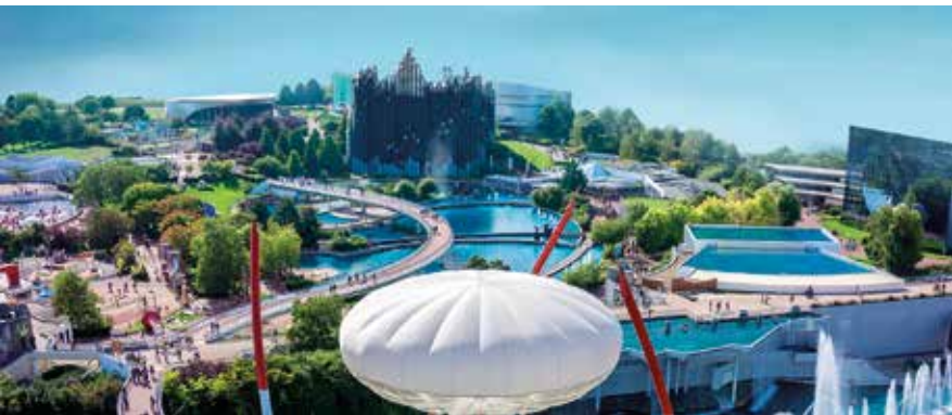
Futuroscope - J.L. Audy/Aircopter/Aérophile/D. Laming, Architecte

Laat u verrassen door de technologie van morgen, stap de vierde dimensie in zonder uit uw stoel te komen en geef uw ogen en andere zintuigen de kost! Zie blz. 374.