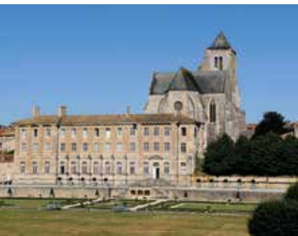
Celles-sur-Belle, de abdij met de abdijkerk en de tuinen

♥ Voel u even een ridder bij de ruïnes van het kasteel en de stadswallen van Angles. Sinds de renovatie hebben bezoekers toegang tot de burcht, die mooi uitzicht biedt op het pittoreske plaatsje en het riviertje de Anglin. Zie blz. 392.