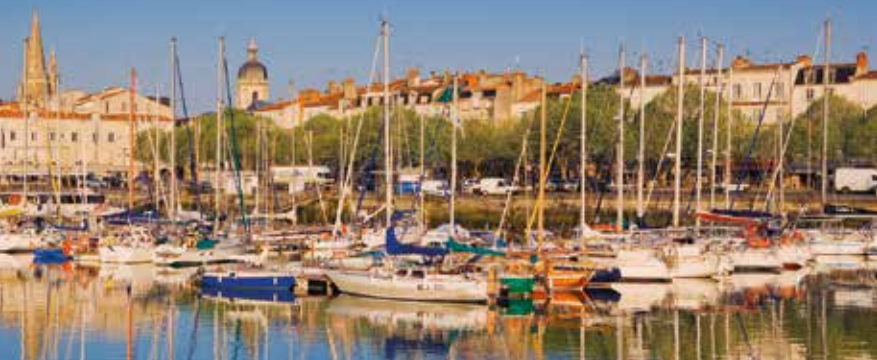
De oude haven van La Rochelle