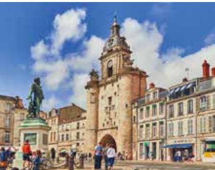
La Rochelle, Tour de la Grosse Horloge