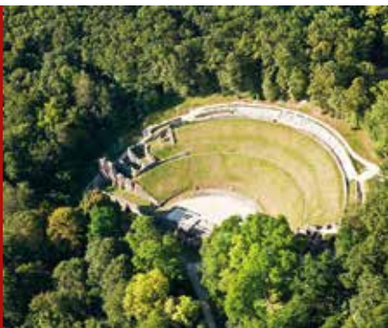
Théâtre Gallo-Romain van Les Bouchauds

♥ Kijk wat rond in Verteuil-sur-Charente en breng een bezoek aan het kasteel, dat eigendom is van de familie La Rochefoucauld. Bewonder in de kerk de 16de-eeuwse Graflegging , die wordt toegeschreven aan het atelier van Germain Pilon, en ga naar een bakkerij om een brioche feuilletée te proberen. Zie blz. 299.