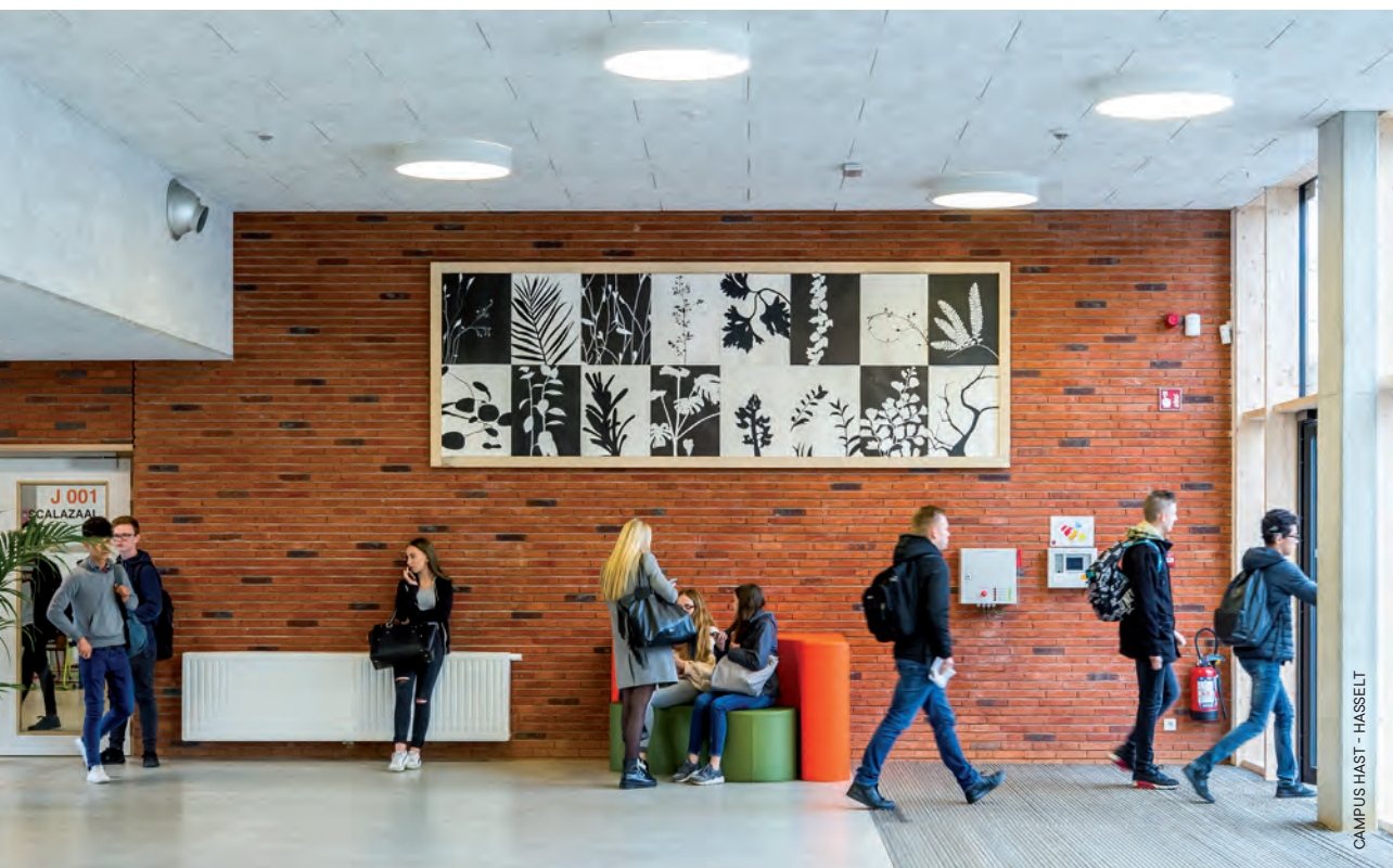
CAMPUS HAST - HASSELT

Wat je uit het werk van Robinson kunt leren, is dat het feit van een bestaande infrastructuur je niet mag tegenhouden om ermee aan de slag te gaan. Een leeromgeving creëren die leren stimuleert en de opgesomde 21st century skills mee helpt installeren, is een opdracht die je niet mag uit de weg gaan, omdat de gebouwen waarin je werkt ze niet zouden toelaten. Er zijn andere middelen en mogelijkheden om zo'n inspirerende leeromgeving te realiseren. Dit boek wil daar alleszins een voorzet toe geven.