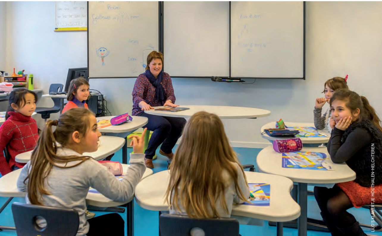
LILIS KLAVERTJE HOUTHALEN-HELCHTEREN