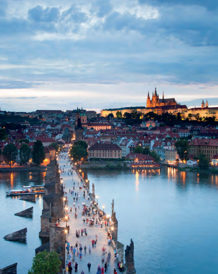
De Karelsbrug met aan de horizon de Praagse Burcht