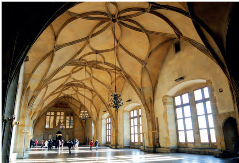
De Wladislawzaal in het voormalig Koninklijk Paleis

andere schilders uit het noorden, zoals Bruegel en Dürer. De werken die hij niet in handen kon krijgen, liet Rudolf kopiëren. Zo zorgde Joseph Heintz de Oude voor een reeks kopieën van Titiaan. In 1590 werd de Praagse School opgericht rond de schilders van Aachen, Spranger (1546-1611) en Heintz , de beeldhouwer Adriaen de Vries (ca. 1560-1626) en de Milanees Giuseppe Arcimboldo (1527-1593), beroemd om zijn portretten samengesteld uit fruit, bloemen, groenten enz. De kunst werd ook gebruikt voor keizerlijke propaganda. Mythologie en allegorie werden aangewend om het