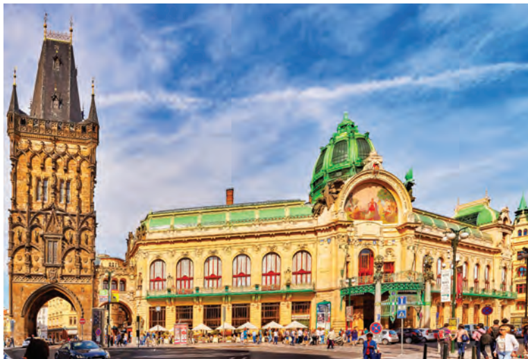
De oude Kruittoren en het Gemeentehuis in Praagse secessionstijl