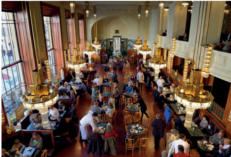
Het café in het Gemeentehuis

♥ Varen op de Moldau. Bewonder de stad van een heel andere zijde, terwijl u zelf rustig geniet. Per toeristenboot, roeiboot of waterfiets, aan u de keuze. 📍 blz. 14 en blz. 19.