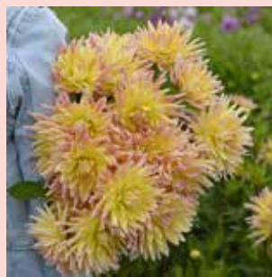
Cabana Banana L 90 cm ✂