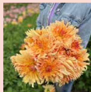
Big Brother XL 90 cm