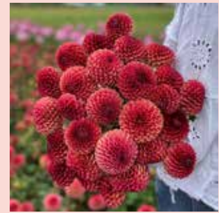
Copperboy S 80 cm ✂ 🌿