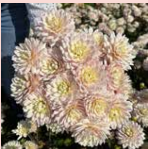
Diana's Memory M 70 cm ✂ 🌿