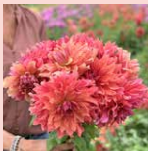
Belle of Barmera XL 95 cm