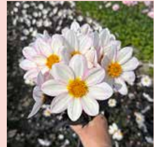
Dahlegria White M 55 cm 🌿