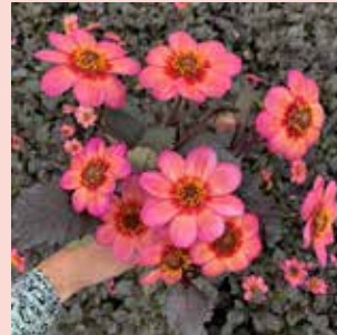
Dahlegria Tricolore M 55 cm 🌿