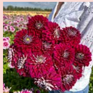
Embassy M 90 cm ✂