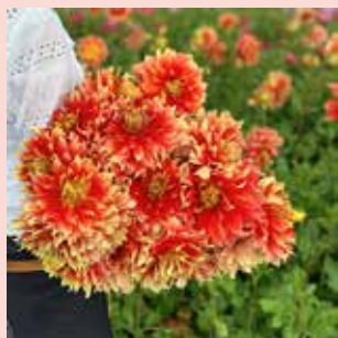
Bodacious XL 90 cm