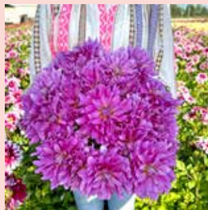
Bluetiful M 80 cm ✂