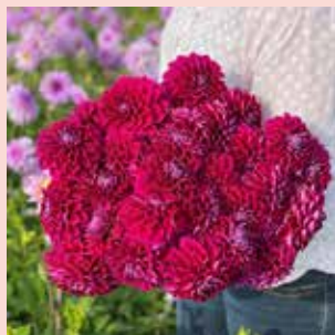
Diva M 100 cm ✂