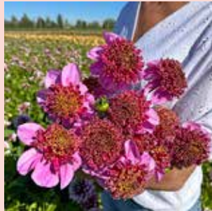
Dad's Favorite M 90 cm