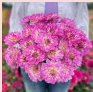
Bitsy M 40 cm 🍷