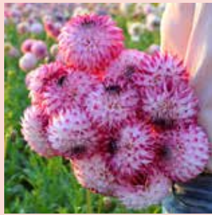
Caproz Pizzazz M 90 cm ✂