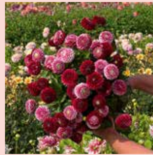
Chick a Dee S 80 cm ✂