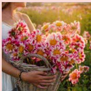
Bumble Rumble M 90 cm