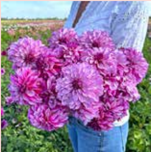
Cranberry Classic M 90 cm ✂