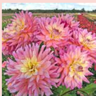
Bahama Mama M 100 cm ✂