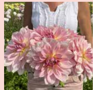
Fairway Pilot XL 70 cm 🌿