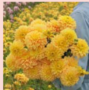
Bocherell M 90 cm ✂