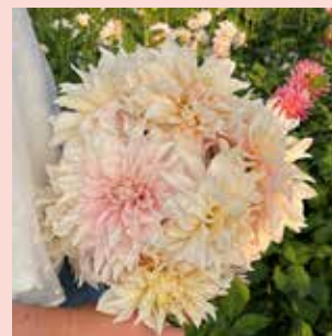
Cafe au Lait XL 100 cm ✂