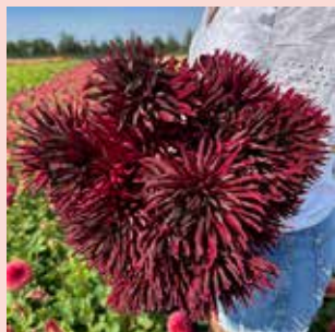
Black Narcissus L 90 cm ✂