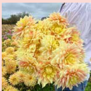
Advance XL 110 cm

Wat je ook uitzoekt, elke combinatie is mooi. Gebruik dit overzicht voor het vinden van de dahliaplanten van jouw smaak. Op onze website www.famflowerfarm.nl kun je in de dahlialist selecteren op hoogte, bloemgrootte en -tint. Ook kun je er de soorten voor potten en je pluktuin handig mee uitzoeken. Succes met kiezen ;-)